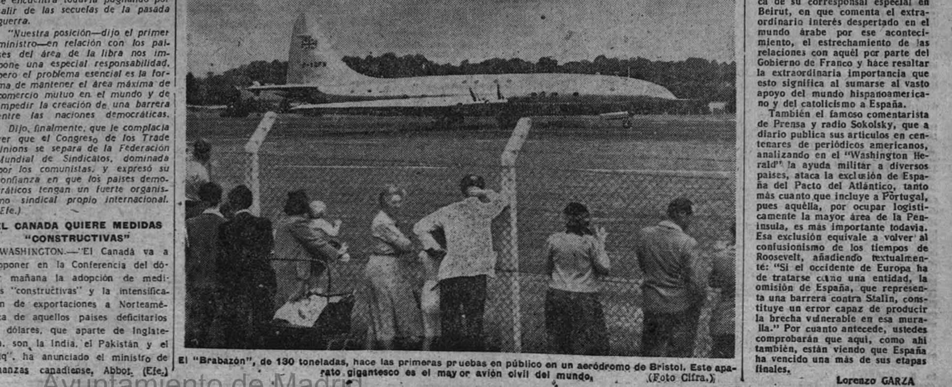
El "Brabazon", de 130 toneladas, hace las primeras pruebas en público en un aeródromo de Bristol. Este aparato gigantesco es el mayor avión civil del mundo.