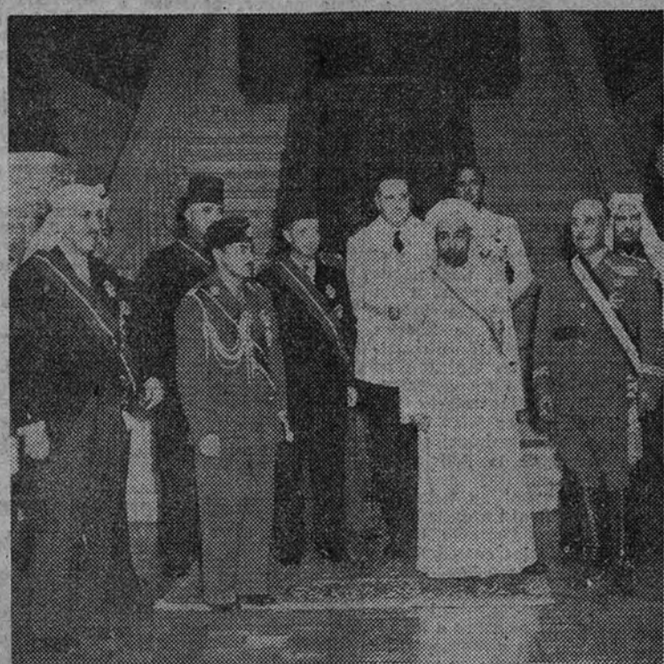
En el Pazo de Meirás, el Caudillo, acompañado del Ministro de Asuntos Exteriores y otras personalidades, recibe al Rey de Jordania poco antes de comenzar el almuerzo de gala con que fue obsequiado el Rey y su séquito

Por todo ello, esta Alcaldía invita a todos a recibir a tan egregio visitante, y así poder testimoniar el agradecimiento del pueblo de Madrid por el honor de su visita, a quien ha de ser, durante los días de su estancia, el más cordial y entusiasta de nuestros huéspedes.