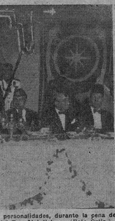
El Jefe del Estado y el Rey de Jordania, acompañados de Ministros y personalidades, durante la gala celebrada en el Casino de La Coruña en honor del Rey Abdullah

tal de las comunicaciones del oeste gallego. Desde La Toja, pasando por Santiago, Pontevedra y Marín, la moderna caravana motorizada que forman las comitivas del Caudillo y del Rey de Jordania ha recorrido hoy, ante uno de los más bellos paisajes españoles y con tiempo espléndido, el eje vi-