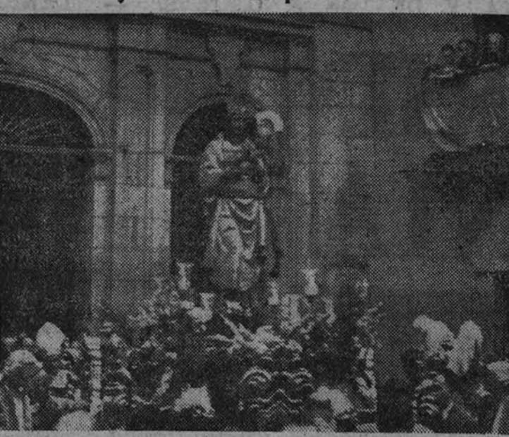
La imagen de la Virgen de la Almudena al iniciar el desfile procesional.

Madrid festejó ayer, con la solemnidad y fervor acostumbrados, a su excelsa Patrona, Nuestra Señora de la Almudena. Por la mañana, a las once, se celebró en la iglesia de Santa María (calle del Sacramento) una misa solemne, en la que el Ayuntamiento en corporación cumplió el tradicional Voto de la Villa.