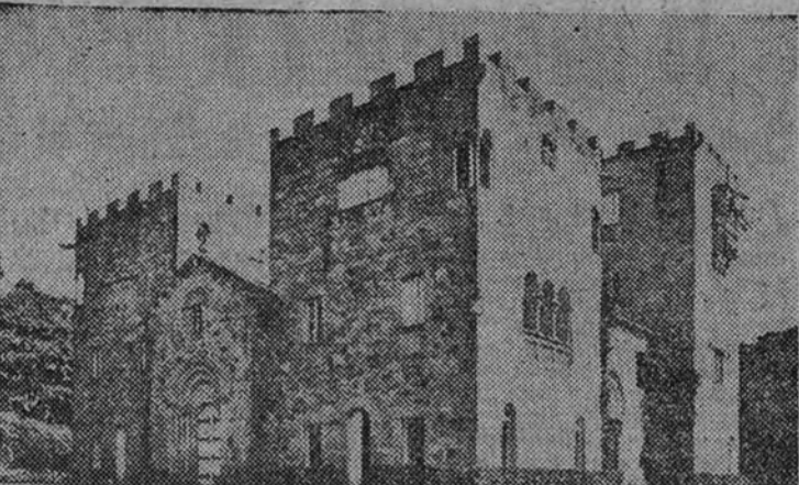
El Pazo de Meiras, residencia veraniega de S. E. el Jefe del Estado, donde se celebró ayer el Consejo de Ministros

El Ministro de Asuntos Exteriores informó sobre la visita del Rey de Jordania