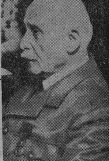
Entrevistada en la isla de Yeu por un redactor de la Associated Press, la esposa del mariscal Petain ha declarado que los rumores respecto a la salud de su esposo han sido exagerados. Se encuentra bien —ha dicho— en general, sobre todo teniendo en cuenta su edad y su situación; pero padece mucho a causa de los fuertes calores que le causan una gran sofocación. La soledad también le hace sufrir mucho. Los otros presos políticos pueden hablar entre ellos, mientras que a él se le ha negado esta tolerancia. No ve a ninguna otra persona más que a mí. Sus noches son espantosas; me despierto a las tres y me quedo dormida. No puedo dormir más que una hora y se pasa en la cama como un león enjaulado.

UNAS DECLARACIONES DE LA ESPOSA DEL MARISCAL