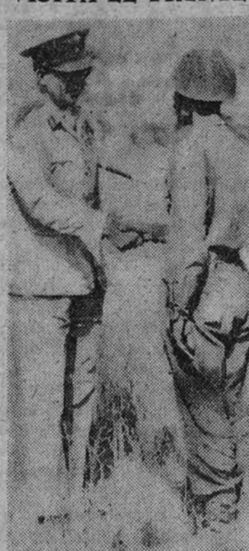
Jorge de Grecia ha visitado la ciudad de Grammos, cerca de la frontera albanesa, recientemente conquistada por sus soldados. En la foto le vemos felicitando a uno de los jefes que más se han distinguido últimamente en las operaciones contra los rojos griegos.

En los pasos por cubierta, bajo las gotas de lluvia de las torres y bajo el ripol blanco de la gran manía de los pintores de barco, se ven pasar por paredes y techos esas sombras de luz que en tierra se ven en el techo patado de las alcobas de la siesta y que revelan el paso de gente por la calle.