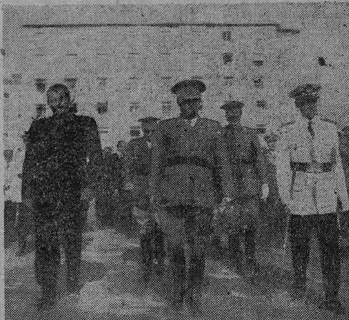
Su Excelencia el Jefe del Estado y Generalísimo Franco, acompañado del Ministro de Trabajo, camarada Girón; del Alcalde de El Ferrol y otras personalidades, saliendo del ambulatorio del Seguro de Enfermedad, inaugurado recientemente en aquella localidad