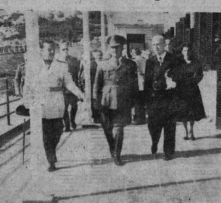
Durante su viaje triunfal por la provincia de Orense, el Caudillo inauguró el nuevo Sanatorio antituberculoso del Pifor, situado a tres kilómetros de la capital. Acompañan a Su Excelencia en el acto inaugural el Gobernador Civil y el inspector provincial de Sanidad.