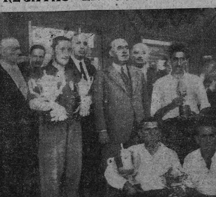
Su Excelencia el Jefe del Estado hace entrega de los premios a los patronos de las traineras que resultaron vencedoras en las regatas el pasado domingo en La Coruña.