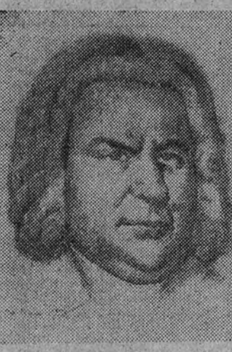
Juan Sebastián Bach

Solista, conjuntos vocal e instrumental... coros mixtos, otros de cámara, arcos, recitativos, duos, se suceden con libertad, con prodigiosa pormenorización. "La Pasión" se han hecho estudiosos, a cuyo nivel no podría llegar el nuestro; pero no ha de impedírnoslo el reflejo escueto de aquellos aspectos y momentos que más impresionaron y produjeron. En primer término la belleza infinita, la hermosa frase. La inspiración mena generosa, noble, limpia de alardes y efectismos, con una mezcla de naturalidad y hondura, en su radica su mayor encanto. Así, en la frase de Jesús "Mi alma está triste", en la tan sublime y conmovedora "Dios mío, Dios mío, ¿por qué me has abandonado?", en la melodía prodigiosa que el coro canta en la primera parte y en la entrada de los hombres del número que abre la segunda—canto con homogeneidad, empuje, brio e ilusión vi-