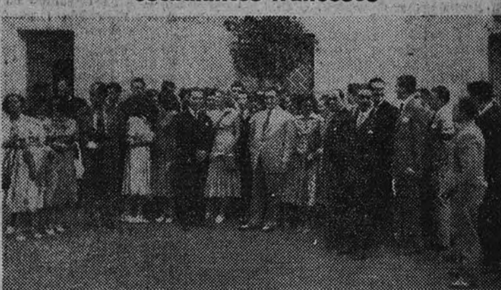
Los estudiantes españoles y franceses, con el Jefe Nacional del S. E. U., durante la fiesta

Se celebró en honor de un grupo de estudiantes franceses