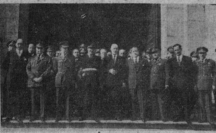
El director general de Prisiones, con los altos funcionarios del Cuerpo, al salir de la función religiosa de San Francisco el Grande

En San Francisco el Grande se ofició una solemne función religiosa, con asistencia del director general