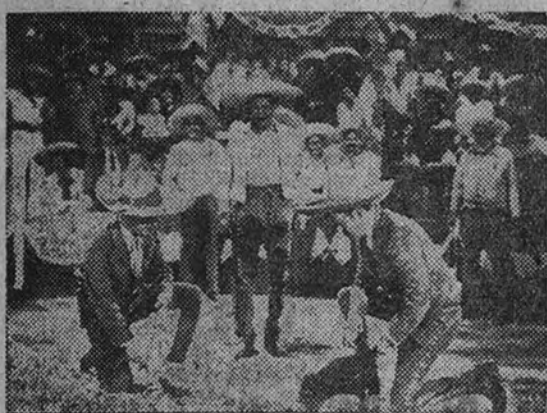
VEA Y OIGA A JORGE NEGRETE

¿PUEDE UN HOMBRE ROBAR A OTRO LA NOVIA EN LA VISPERA DE SU BODA?