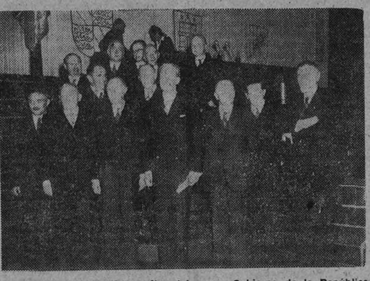
Una de las primeras fotografías del nuevo Gobierno de la República occidental alemana, presidido por el doctor Adenauer

Los rusos están armando hasta los dientes a la "Policía Popular" de su zona