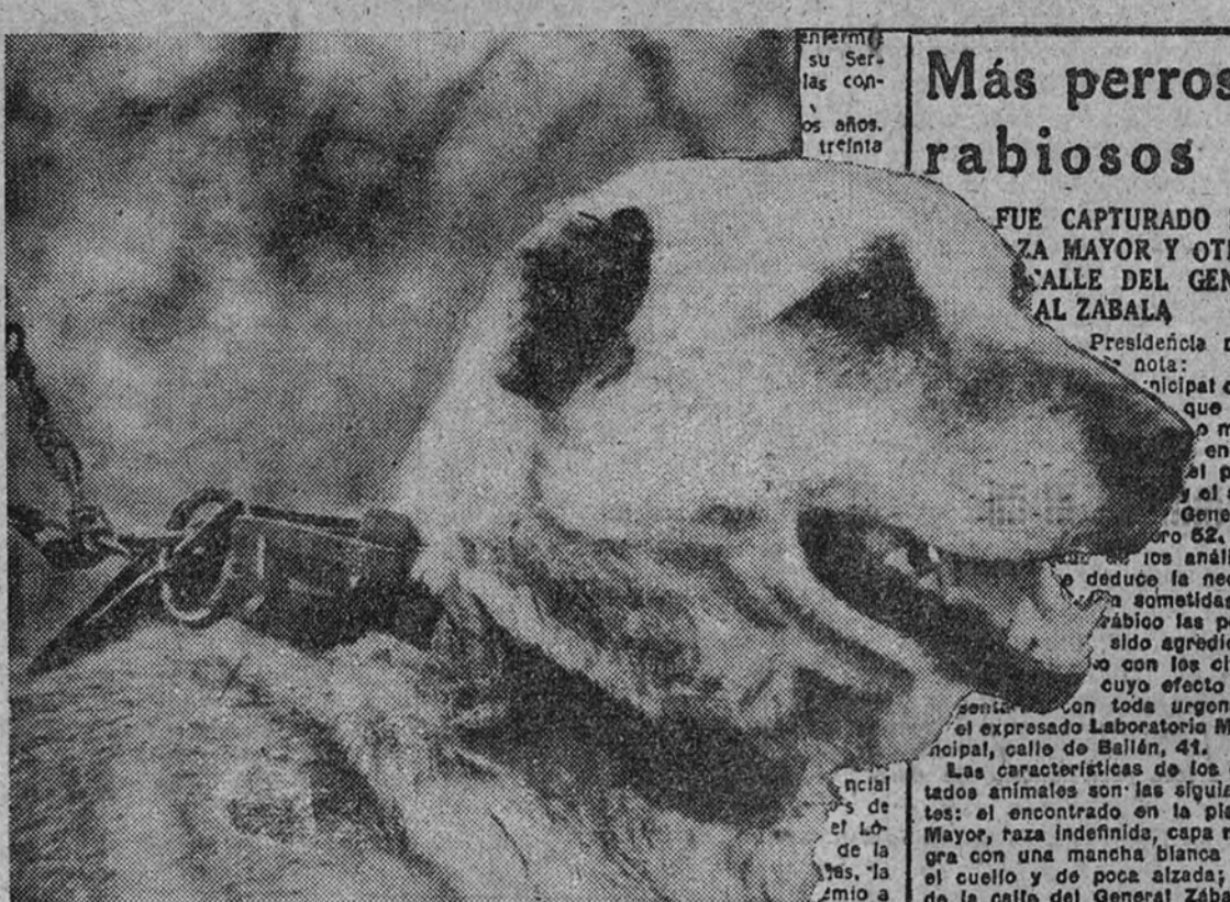
Así como el más ilustre caballo puede acabar en una tarde de toros, una simple nota del Laboratorio Municipal es el fin posible del perro más conspicuo

El Ayuntamiento emprende una campaña sanitaria para la inmediata localización de los casos de hidrofobia