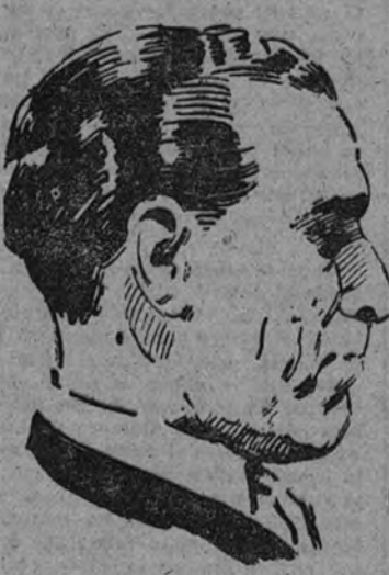
Enrique de Ocerín

La propuesta del señor Ocerín fué aceptada por unanimidad Será ensayada durante un año la puntuación de 0 a 5 en los combates Regresó don Enrique de Ocerín de Roma, donde asistió al III Congreso Internacional de la European Boxing Union. Allí se tomaron algunos acuerdos de importancia en el futuro. Sobre este Congreso nos dice el señor Ocerín, presidente de la Federación Española de Boxeo y vicepresidente del organismo internacional: —Maravilloso de organización y de significación. Estaban representados todos los países más importantes de Europa y asistió una elevada personalidad boxística de los Estados Unidos. Para España se guardaron las mayores atenciones, hasta el punto de que fueron aceptadas varias sugerencias nuestras y la propuesta de celebrar el III Congreso en nuestra Patria, con lo que se afirma el prestigio del deporte español. Es agradable añadir que el acuerdo fué adoptado por unanimidad. —Se llegó a una inteligencia con el representante norteamericano para la disputa de títulos mundiales. —Por ahora hubo buena armonía, y es posible que en corto plazo se lleguen a unificar criterios sobre este aspecto, todavía hemos de tro-