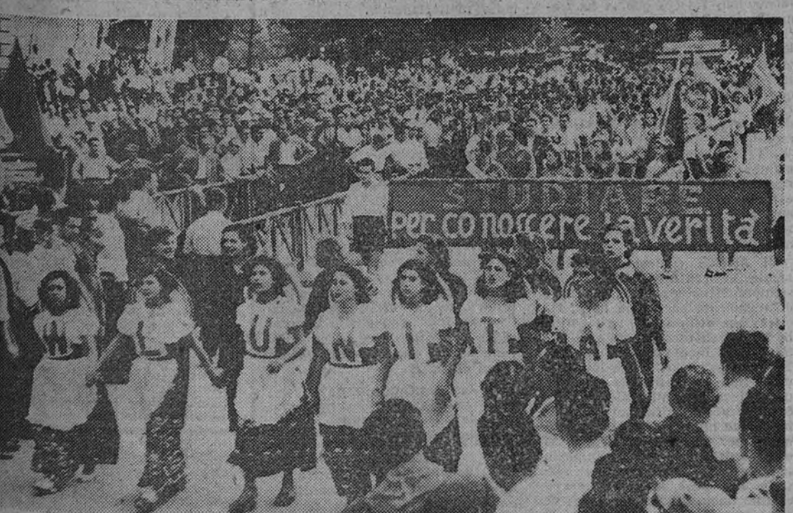
El periódico comunista italiano "L'Unita", organizado en Florencia un desfile, en el cual han participado, según se dice, cerca de 350.000 personas. El motivo de este desfile parece haber sido el deseo de aumentar la tirada del mencionado diario. Como pudo observarse en nuestra fotografía, abren la marcha de la cabalgata, en la cual, como de costumbre, no faltan las ultraderechistas camisetadas. Tras ellas—tras las destronadas—campea un letrero que dice: "Estudiad, al parecer, es la exigencia del señor Stalin que viene luego. Aunque esa no es toda la verdad del caso, si se atiende a los propósitos del plan Marshall, tan diferentes, por desdicha, de su traducción a la realidad. (Fotos Ortiz.)

HONG-KONG.—Informaciones de origen comunista indican que más de 4.000 estudiantes y empleados de oficinas de Pekín ayudan en las obras de una gran plaza roja, capaz para 100.000 personas, frente a la antigua Ciudad Prohibida, residencia que fué de los Emperadores. (Efe.)