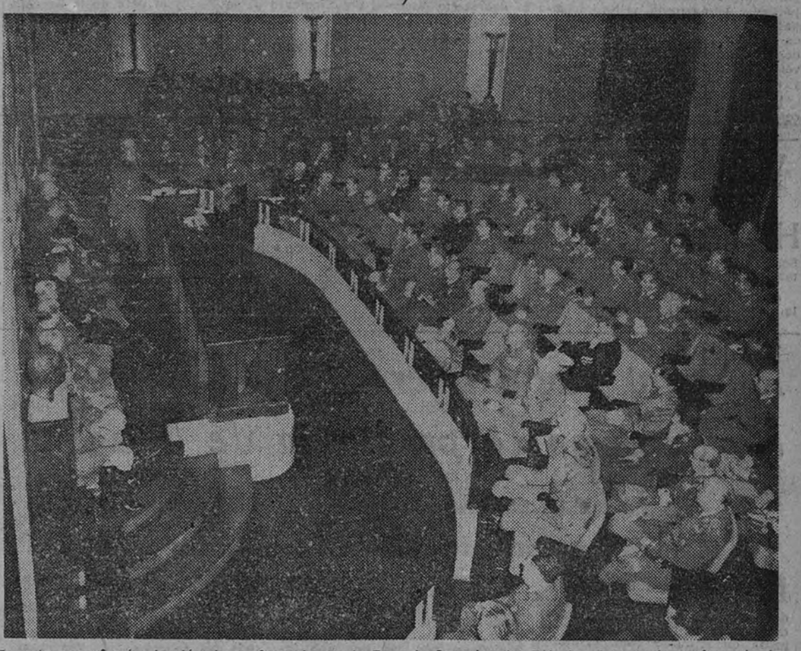
Aspecto que ofrecía el salón de conferencias de la Escuela Superior del Ejército durante la conferencia de apertura de curso pronunciada por el director de la Escuela, teniente general Asensio Cabanillas (Información en segunda plana.)