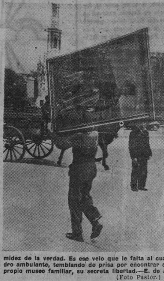
medez de la verdad. Es ese velo que le falta al cuadro ambulante, temiendo de perderse encontrar su propio museo familiar, su secreta libertad. —E. de A.