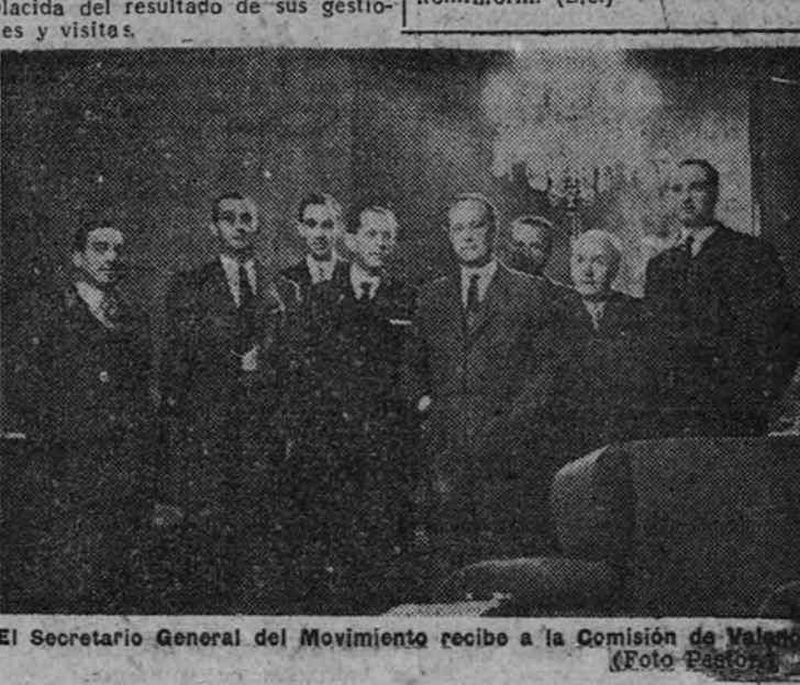
El Secretario General del Movimiento recibe a la Comisión de Valencia.