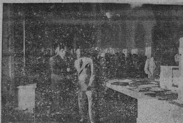
El Ministro de Educación Nacional, señor Ibáñez Martín, clausura una de las Exposiciones de trabajos escolares en el Centro de Instrucción Comercial

En él se pueden cursar estudios de especialización contable, bachillerato y comercio