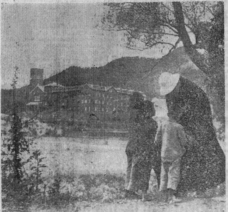
imagen de la Virgen de Begoña, que presidía el altar, ha sido sustituida por enormes retratos de Lenin y Stalin. Y Yanan ha sido por mucho tiempo el Cuartel Central de Mao-Tse Tung, el lugarteniente de Moscú en China.

El heroísmo de los misioneros españoles sigue dando en Extremo Oriente ejemplos de valor y sacrificio