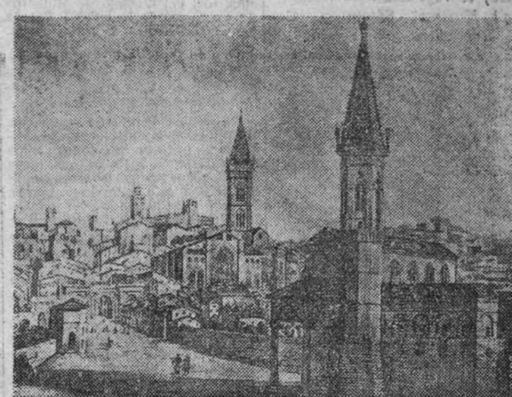
Monasterio de Casinasi di S. Pietro, en Perugia, donde se celebran los conciertos de la "Sagra Musicale Umbra"

CUANDO se vea nieve en las cumbres será perfecto paisaje de "nacimiento": ahora, toda la umbría, la tierra franciscana, tierra de viñas, de cipreses, de largas, luminosas, esbeltas perspectivas, vive la espléndida madurez del estilo consumado. Un paisaje, es verdad, de tangible y fácil dulzura, cuyo contraste de viril severidad no está en el aire—es la tierra de los cementerios vientos en las casas medievales, como las de Perugia, ruinas, rocas, defensivas. Es verdad también que el contraste cae del lado de la dulzura: la calle de San Francisco en Asís, una calle repleta con "casas de muerto", con casas de alta ventana, ideal para lucha y la defensa, tiene una maceta de geranio en cada hueco y un fresco perfume de rosa minada y espontáneo a la vez. Y el agua, que es una bendición, la "hermana agua" de la fuente de Perugia, oculta por restauraciones, vuelve a salir—lo vemos cuando vuelve a la vida—para que el melodioso sea plenitud de sol, de aire y de sonrisas.