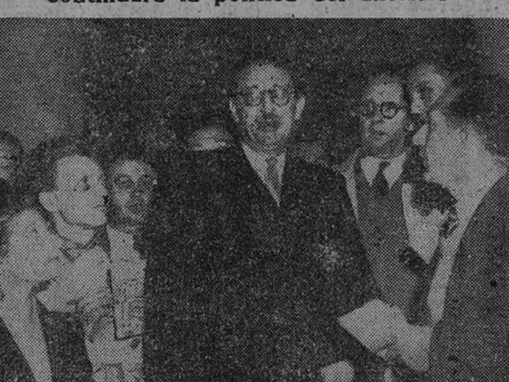
Jules Moch conversa con los periodistas a la salida del palacio del Eliseo, después de haber aceptado el encargo de formar Gobierno

"En la esfera internacional, el nuevo Gobierno continuará la política del anterior"