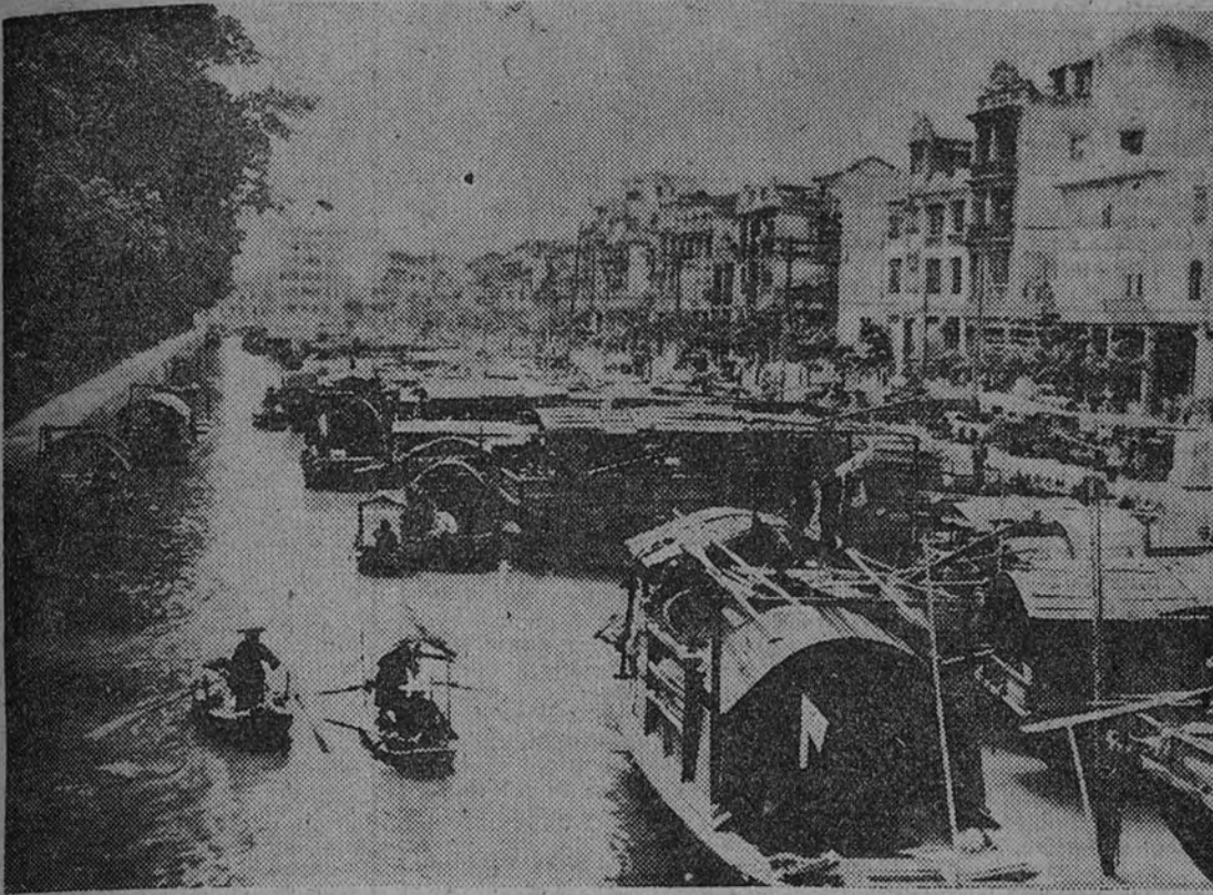
Un aspecto de Canton, la próxima presa del Ejército comunista chino

HONG-KONG.—Las últimas noticias de Canton indican que el Gobierno nacionalista ha accedido a entregar la ciudad el sábado a las fuerzas comunistas. Esta noche—la del jueves al viernes, hora de Extremo Oriente—Canton es una ciudad abandonada, en la que los rojos, situados a poca distancia, en dirección Norte, podrían entrar cuando quisieran. Por la tarde abandonaron la hasta ahora capital nacionalista los últimos altos funcionarios de este, los del Ministerio de Defensa. Horas antes habían salido el Presidente Interino, Li Tsung Jen, y los ministros que se encontraban con él. Un testigo presencial declara que los pasajeros de