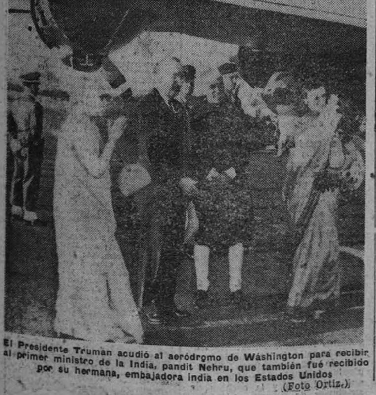
El Presidente Truman acudió al aeródromo de Washington para recibir al primer ministro de la India, pandit Nehru, que también fue recibido por su hermana, embajadora india en los Estados Unidos.