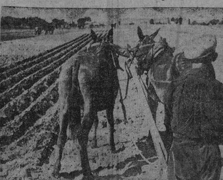
(Viene de primera página.)

Sólo una anarquía en las contrataciones obligaría a intervenir en la libertad de precios