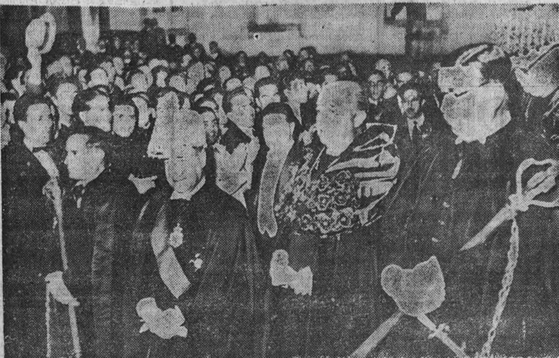
Su Excelencia el Jefe del Estado español penetra con el ceremonial de rigor en la sala de los Capelos de la Universidad de Coimbra, donde recibió el nombramiento de doctor "honoris causa".

Franco visitó ayer el campo de la batalla napoleónica de Busaco. El obispo de Leiria, condecorado por el Caudillo con la Orden de San Raimundo de Peñafort. Clamorosas ovaciones del pueblo subrayaron el paso del Caudillo desde Busaco a Lisboa en su última jornada de estancia en Portugal.