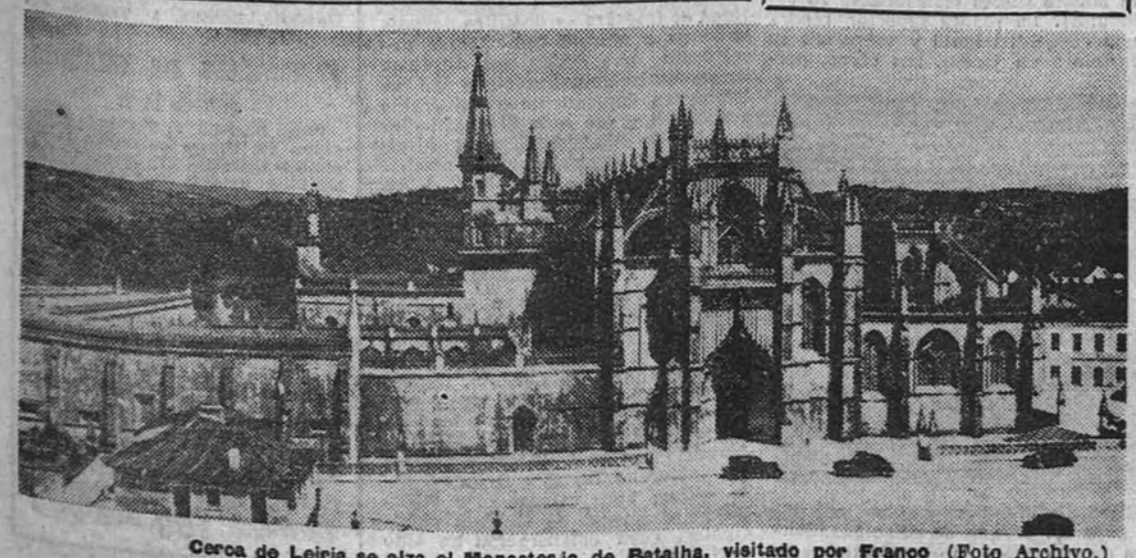
Coroa de Leiria se alza el Monasterio de Batalha, visitado por Franco