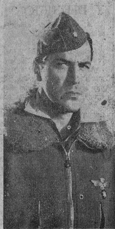
El excelente actor Antonio Vilar, protagonista de la película

Han colaborado en su realización los Ministerios del Aire y Marina.—Los ases de las acrobacias aéreas han batido sus propios "récorde" en escenas espectaculares.—El humor y el drama, interpretados por un reparto gigantesco