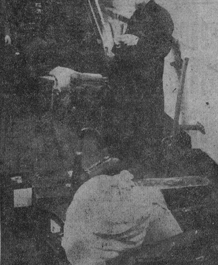
Un misionero español abandona la tierra patria y se dirige a su destino.

Un misionero español abandona la tierra patria y se dirige a su destino. ¿Asia? ¿América? ¿Africa? Sobre poco más o menos, es lo mismo. Apoyado en la borda, sonriente y feliz, ocea de sus bártulos de viaje, entre los cuales no falta el insustituible paraguas, que es también paraseles, el misionero inicia su camino, que es en gran parte el camino real de España.