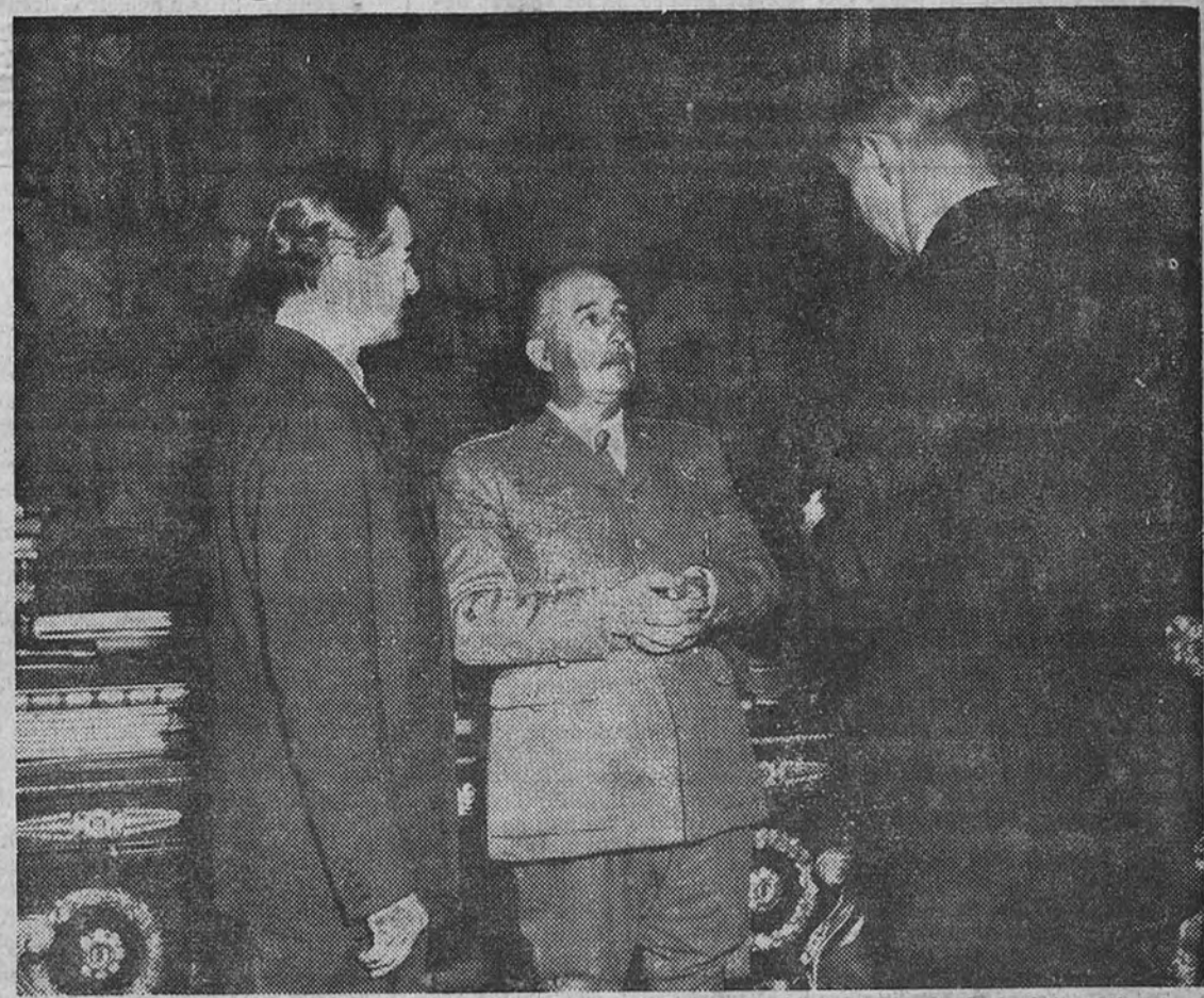
Su Excelencia el Jefe del Estado con mister Seymour Berkson, director general de la International News Service

"Las necesidades económicas más importantes de España son las que se derivan de su función lógica en un plan de defensa de Europa"