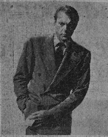
El célebre actor Gary Cooper es el protagonista de "El buen Sam", que desde mañana lunes se proyectará en el cine Albeniz.