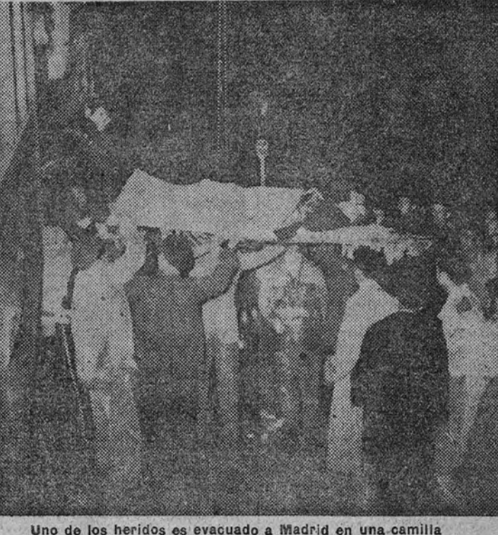
Uno de los heridos es evacuado a Madrid en una camilla

A las siete cincuenta de la tarde de ayer, el tren eléctrico 6.005, de Madrid a Avila, que había salido de la estación del Norte a las 19.30, alcanzó en el kilómetro 21, entre la estación de Las Rozas y la de Las Matas, al 7.009, que se dirigía a Segovia y había partido de Madrid a las 19.25. A consecuencia del accidente resultaron trece personas muertas y más de treinta y una heridas.