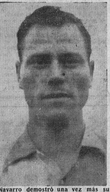
Navarro demostró una vez más su clase en el partido de Sarriá