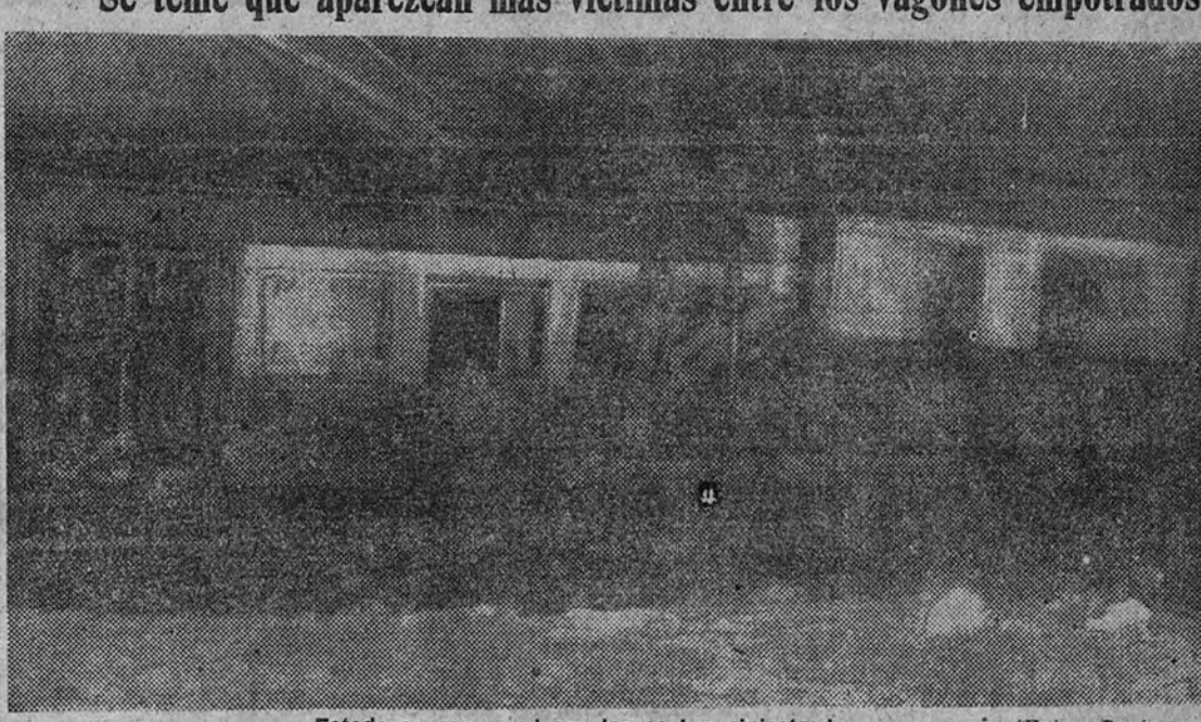
Estado en que quedaron los coches siniestrados.

Se teme que aparezcan más víctimas entre los vagones empotrados