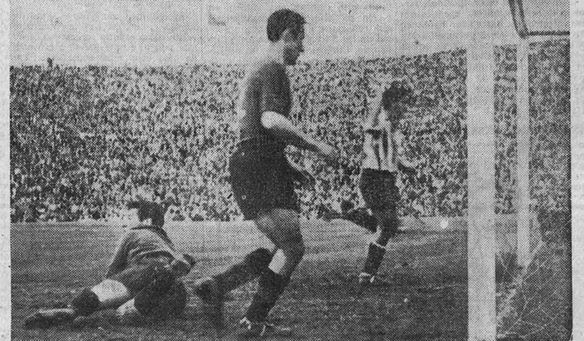
Este fue el tercer gol encajado por el Barcelona, obra también de Carlsson, al cruzar fuera del alcance de Velasco un balón magníficamente servido por Escudero. Tampoco en esta foto aparece el autor del tanto.

TARRAGONA.—Dauder; Mariategui, Catalá, Cobo; Ernesto, Lécue; Solé; Taltavul, Callarod, Vázquez y Roig.