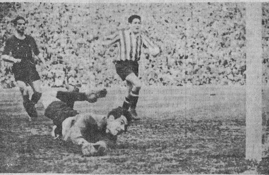
Carlsson tuvo, por fin, su tarde. Frente al Barcelona consiguió tres espléndidos goles, el primero de los cuales reproduce la foto. Escudero había lanzado un fuerte disparo, que Velasco no detuvo convenientemente, circunstancia que aprovechó el interior rojiblanco—a quien no se ve en la foto—para llevarlo al fondo de la red.

Así, si creemos que la calidad de los jugadores del Atlético es capaz de conseguir un fin práctico, ante el Barcelona los componentes del equi-