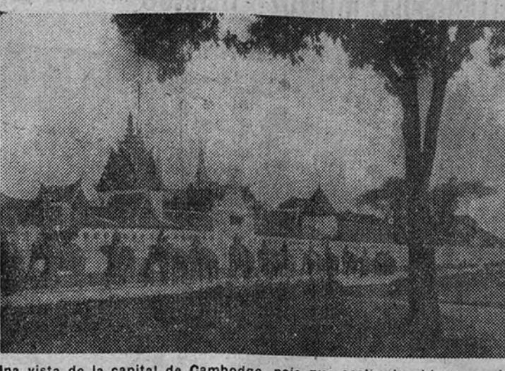
Una vista de la capital de Camboya, país que acaba de obtener su independencia, según acuerdo firmado ayer en el Quai d'Orsay