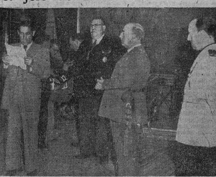
Una Comisión de mineros del Rif ha sido recibida por el Caudillo en el palacio de El Pardo. Uno de los representantes da lectura al ofrecimiento de un artístico pergamino al Jefe del Estado

Otras audiencias de Su Excelencia el Jefe del Estado