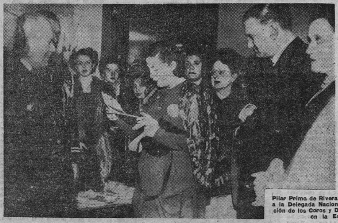
Pilar Primo de Rivera recibe las insignias de la Orden del Sol, concedida a la Delegada Nacional de la Sección Femenina por la magnífica actuación de los Coros y Danzas, a la que vamos durante una fiesta celebrada en la Escuela Naval de la Punta, en Calao

El Presidente de la República, ministros y Cuerpo diplomático asistieron a la función