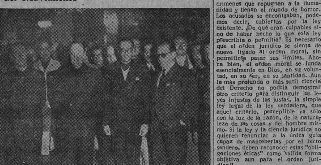
El Ministro y Secretario General del Movimiento, camarada Fernández-Cuesta, en el acto de dar posesión de su cargo al nuevo Secretario Nacional de Sindicatos, camarada Montero.

Presidió el acto el camarada Fernández-Cuesta y asistieron numerosas jerarquías del Movimiento