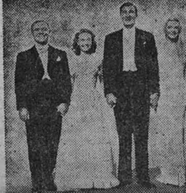
EXCLUSIVA DE PELICULAS MEXICANAS S.A. O. C.V.