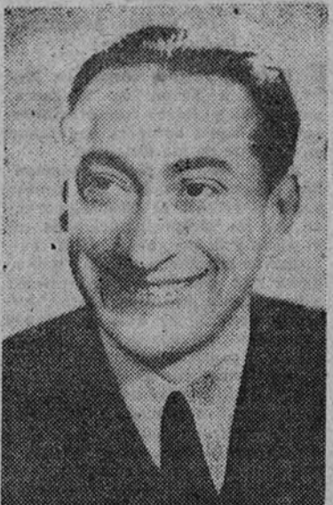
Marcos Redondo, famoso divo, que diariamente logra en el teatro Calderón las mejores ovaciones en premio a su maravillosa creación en "El pájaro azul", una de las zarzuelas predilectas del público, original de López Monís y maestro Millán