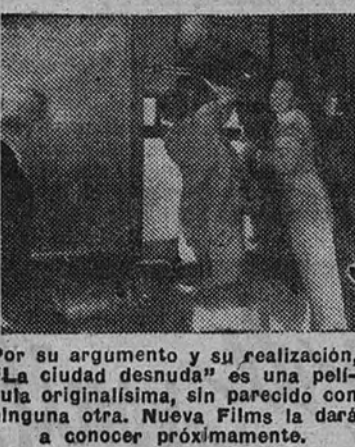
Por su argumento y su realización, "La ciudad desnuda" es una película originalísima, sin parecido con ninguna otra. Nueva Films la dará a conocer próximamente.