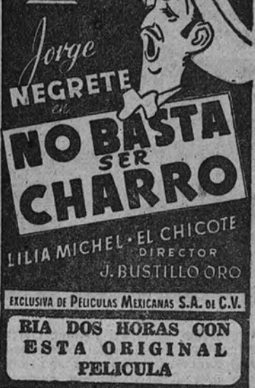
EXCLUSIVA DE PELICULAS MEXICANAS S.A. O. C.V.

Y es que el tema de la película, tan profundamente española, es uno de los que con mayor fuerza hicieron siempre la sensibilidad popular. Las legendarias fechorías de Sierra Morena y la trama dramática, realizada en plena serrería andaluza, se plentan en esta película, transcripción del limpio y apasionante romance de unos grandes poetas y artística herencia de una fuerte tradición popular.