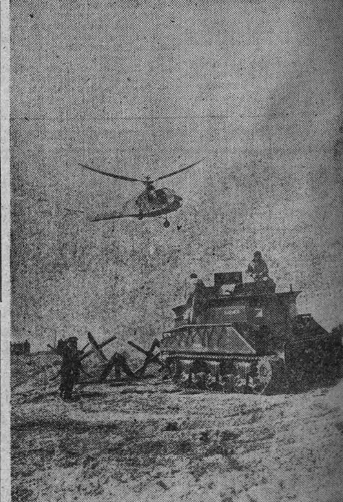
Un tanque se dirige contra las posiciones "enemigas", mientras sobre el cielo un helicóptero, el cual de las maniobras combinadas que se están celebrando en Inglaterra y que son las mayores realizadas desde el final de la guerra.