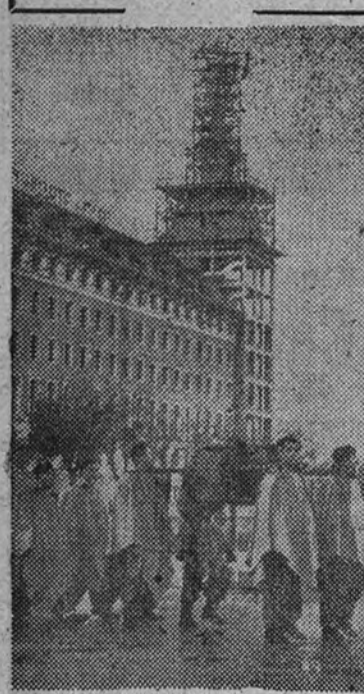
Las camaradas de la Vieja Guardia alicantina llevan a hombros la arca que con la primera tumba de José Antonio, a su salida de Madrid para El Escorial

ASISTENCIA DE PRODUCTORES Por coincidir el presente año la fecha del 20 de noviembre, 13 aniversario de la muerte de José Antonio, con la festividad dominical, que es incompatible con la celebración de funerales, el acto que conmemora dicha fecha se celebrará mañana lunes, día 21, con la misma solemnidad que en los años anteriores, en el Monasterio de El Escorial. Para la asistencia al expresado acto de las personas invitadas y de los camaradas que han de participar en el mismo se dictarán por el Ministerio de Educación Nacional y por la Delegación Provincial de Trabajo de Madrid las oportunas órdenes para declarar festivo a los efectos universitarios y para que las distintas Empresas concedan permiso a los productores que hayan de asistir.