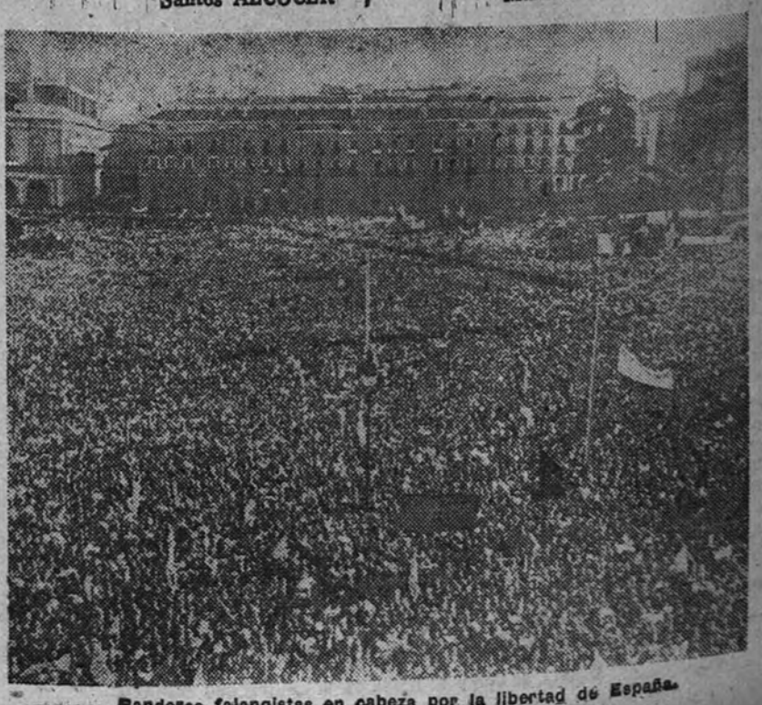
Banderas falangistas en cabeza por la libertad de España