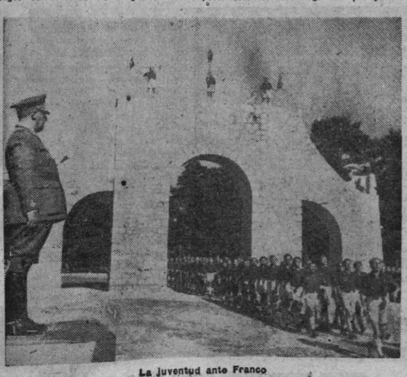
La juventud ante Franco