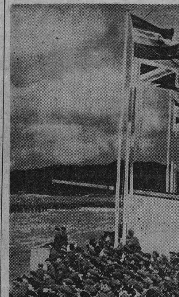
La victoria sin alas