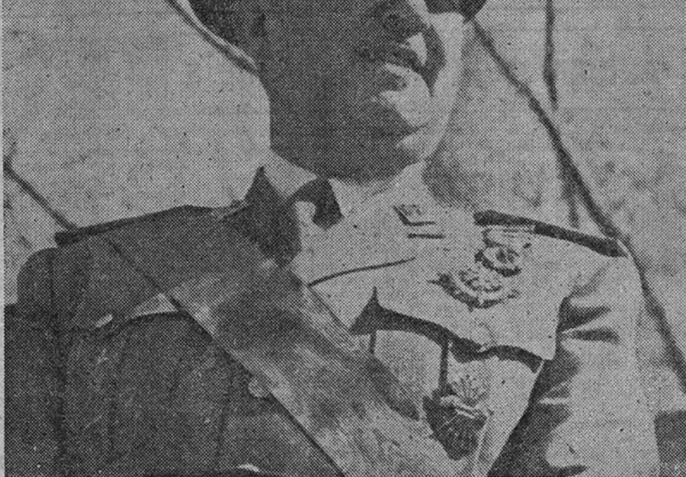
El Jefe Nacional de la Falange, Caudillo de la neutralidad española