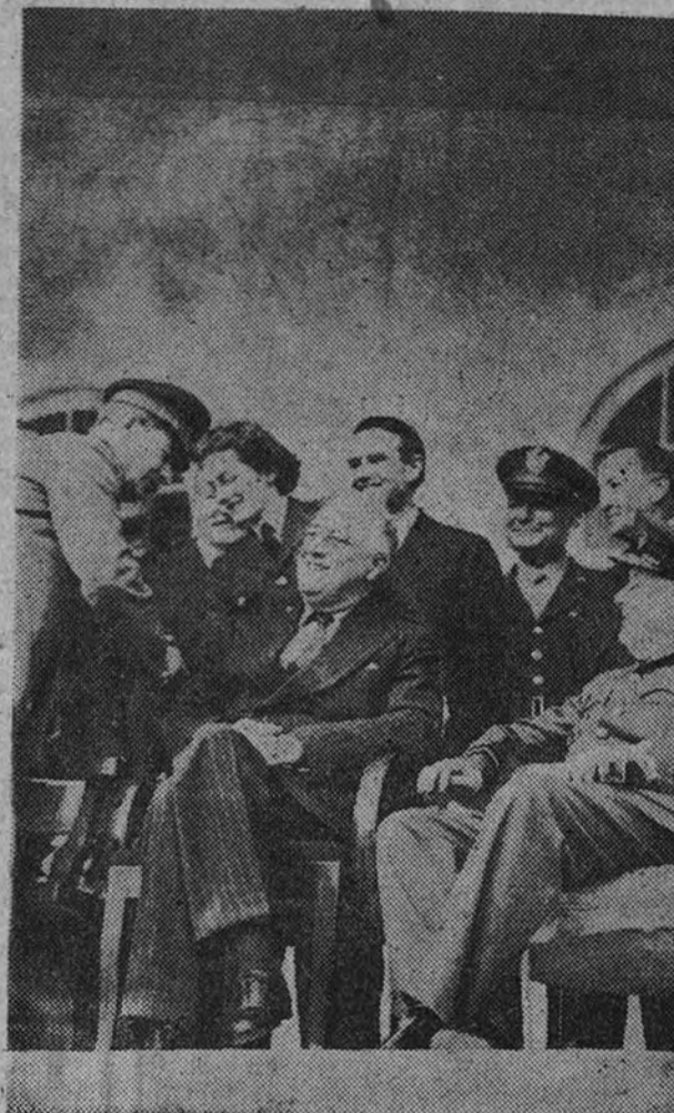
Democracia y comunismo en Teherán