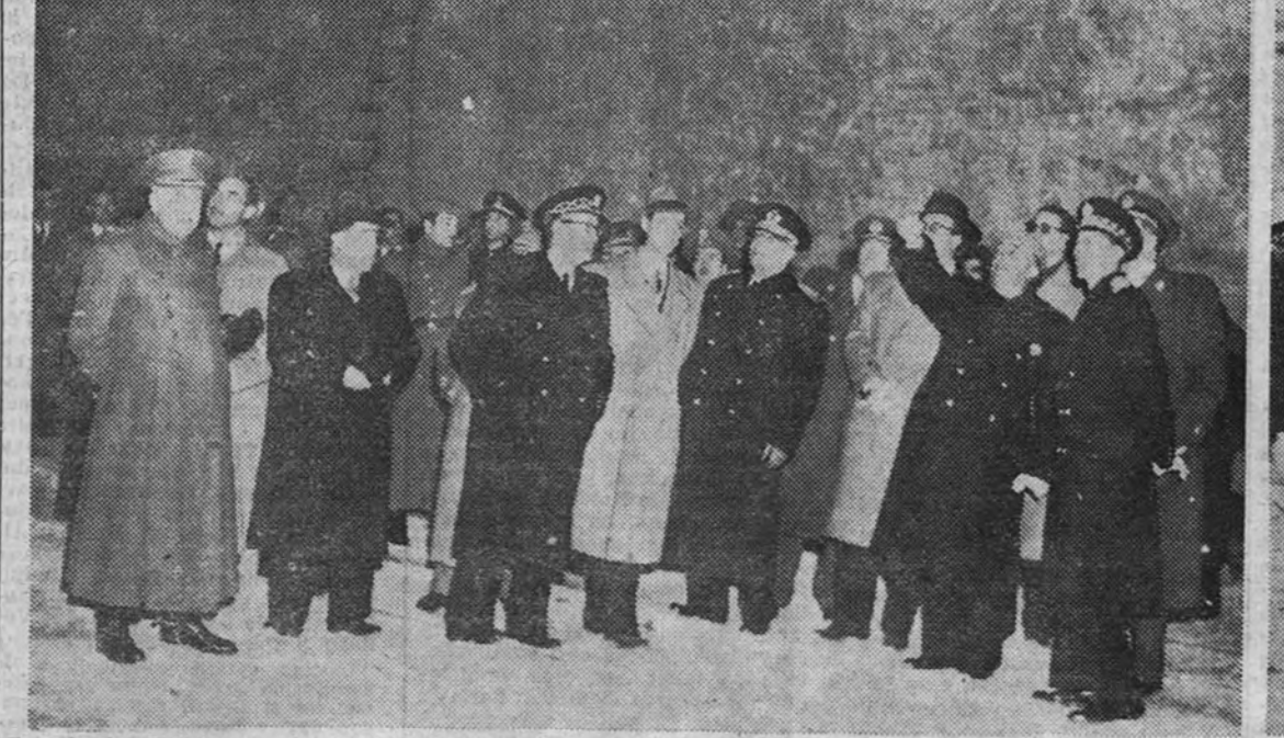
El Jefe del Estado, con los Ministros, el director general de Bellas Artes y otras personalidades, visitan la cripta del Valle de los Caídos

CASTELGANDOLFO. — Su Santidad el Papa Pío XII dijo anoche por radio que toda persona que por hallarse en su lecho de dolor no pudiera participar en la peregrinación a Roma, recibiría la indulgencia del Año Santo o el perdón de todos sus pecados siempre que cumplieran las demás condiciones y los requisitos de la confesión y comunión, además de los actos de piedad y caridad que prescriban los obispos o sacerdotes, de acuerdo con las limitaciones que en cada caso impongan las condiciones de salud. (Efe.)