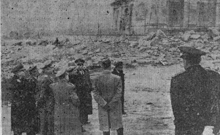
El Caudillo y los Ministros visitan las obras del Valle de los Caidos