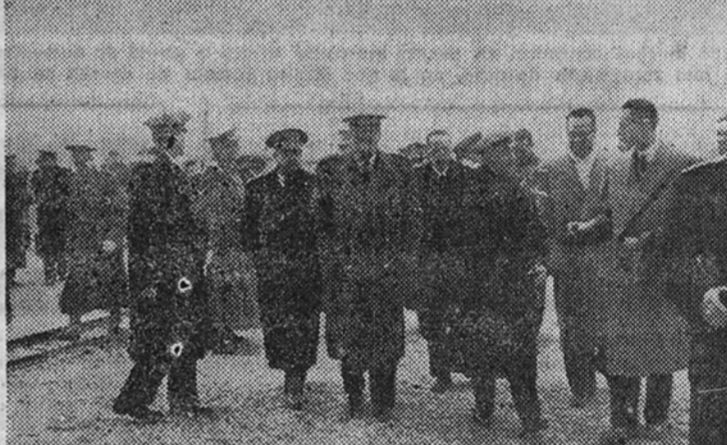
El Caudillo y los Ministros visitan las obras del Valle de los Caidos

Terminada la visita, el Caudillo, acompañado de las personalidades citadas, regresó al palacio de El Pardo.