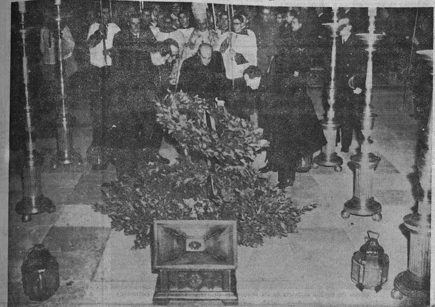
El Caudillo y Jefe Nacional de la Falange, con el Jefe Provincial y Gobernador Civil, el Inspector Nacional de la Vieja Guardia y el Jefe de Protocolo de la Secretaría General, depositan la corona de laurel sobre la tumba del Fundador.

Asistieron el Gobierno, Consejo del Reino, Junta Política, Consejo Nacional y representaciones de las Cortes, Departamentos ministeriales y jerarquías del Movimiento Camaradas de la Vieja Guardia, Guardia de Franco y Frente de Juventudes rindieron honores en el Patio de los Reyes