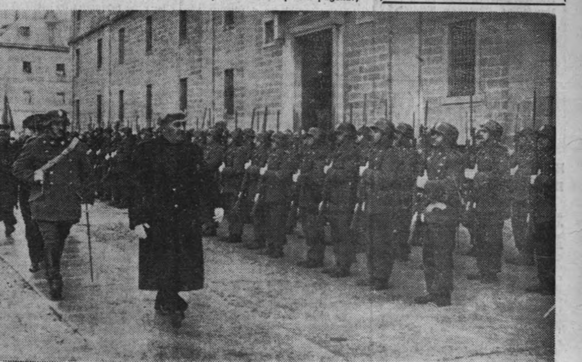
El Jefe Nacional de la Falange pasa revista a las tropas que le rindieron honores