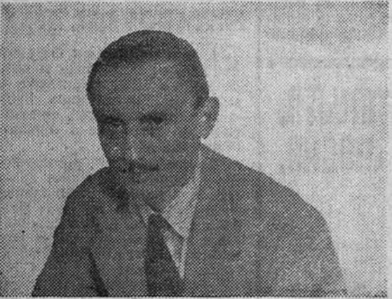
Antonio Buero Vallejo, joven pero ya famoso autor teatral por su extraordinario éxito "Historia de una escalera", la comedia que está batiendo todos los récords de éxito en el escenario del teatro Español y que ha conseguido los elogios de crítica y público madrileños.

MARTES, 22: 10 mañana, Concurso de Coros (Invitación). 6 tarde, Concurso de Danzas (Invitación). 11 noche, "Historia de una escalera". MIERCOLES, 23: 6,45 tarde, Concurso de Coros y Danzas (Invitación). 11 noche, "Historia de una escalera". JUEVES, 24: 6,45 tarde, Recital de Coros y Danzas (localidades, taquilla). 10,45 noche, Recital de Coros y Danzas. Función de gala (Invitación). VIERNES, 25: 6,45 tarde, Recital de Coros y Danzas (localidades, taquilla). 11 noche, "Historia de una escalera". SABADO, 26: Tarde y noche, "Historia de una escalera". DOMINGO, 27: Tarde y noche, "Historia de una escalera".