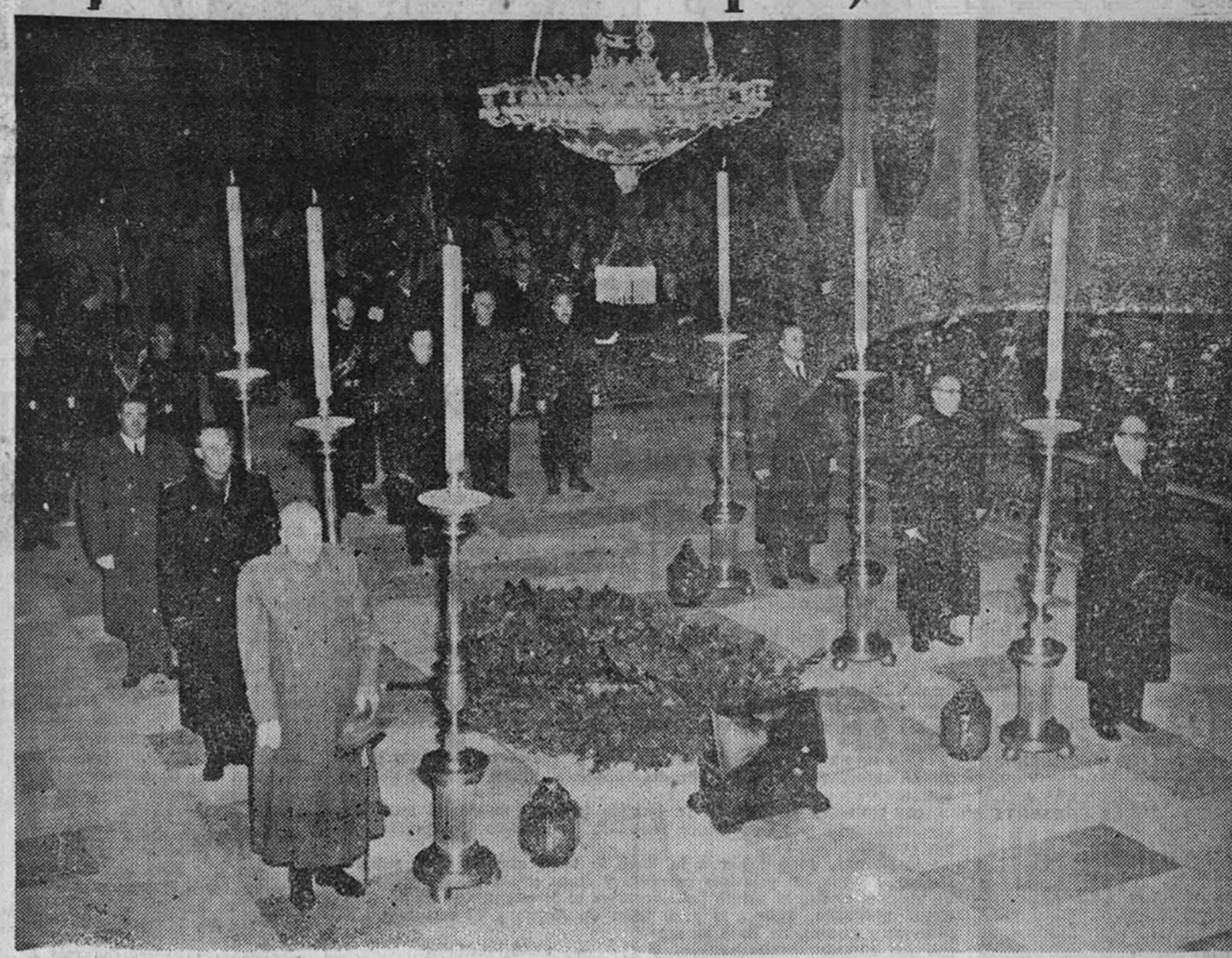
Con el Ministro y Secretario General de la Falange hacen la guardia durante los funerales los Ministros del Aire, Agricultura, Obras Públicas, Gobernación, Industria y Educación Nacional