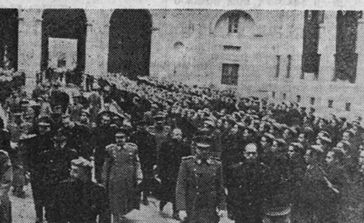
El Caudillo y los Ministros visitan las obras del Valle de los Caidos