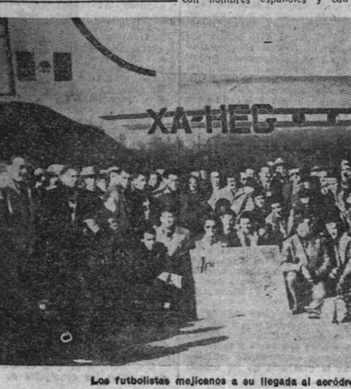
Los futbolistas mejicanos a su llegada al aeródromo de Barajas.

también son simpáticos y efusivos. Tienen voluntad para el trabajo, tienen destreza, y sus soldados son valientes. Si se le presta ayuda para su alimentación y se le facilitan equipos, la economía española puede ser colocada en bases muy firmes". Robertson agregó: "Desde mi punto de vista, el pueblo español es un conjunto de amigos de los que yo puedo estar muy orgulloso". Por su parte, el senador Mac Clellan manifestó: "Si ayudamos a España debe ser en forma de préstamo. Yo opino que eso es todo lo que España quiere. Tengo mucho interés en que el problema ahora existente—el de crear obstrucciones