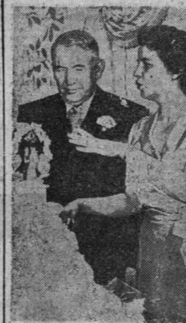
El vicepresidente norteamericano Barkley, y su esposa ante el past nupcial instantes después de cele brarse la ceremonia

és-nada con banderas y flores. También la Unión Nacional organizará la diversos actos de homenaje al Presidente Garmón. (Efe).