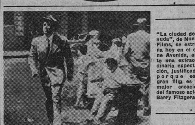
"La ciudad desnuda", de Nueva Films, se estrena hoy en el cine Avenida, ante una extraordinaria expectativa, justificada, porque este gran film es la mejor creación del famoso actor Barry Fitzgerald.