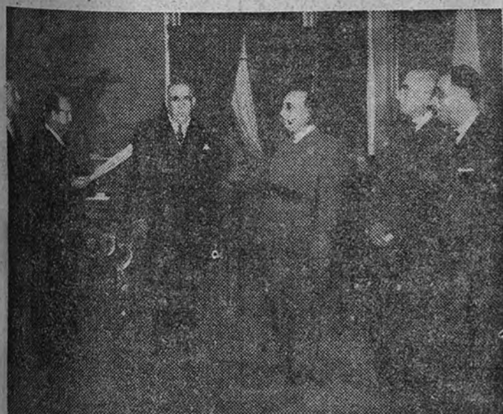
El Consejo de la Federación de Armadores de Pesca durante la audiencia que le concedió Su Excelencia el Jefe del Estado en la mañana de ayer.

También le visitaron el arzobispo de Zaragoza y los jesuitas que van a la Misión de Ahmedabad