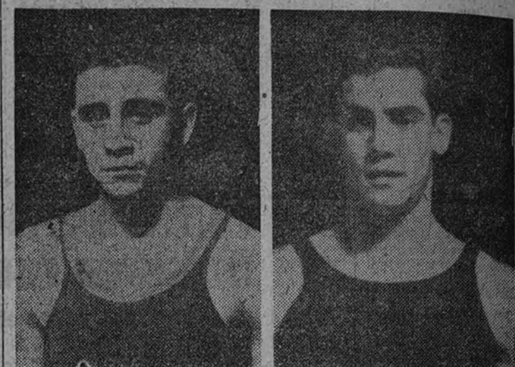
Hill y Bufala fueron dos de los vencedores en el encuentro de la selección española de boxeo aficionado en Turquía

El triunfo fue conseguido por cinco victorias contra tres