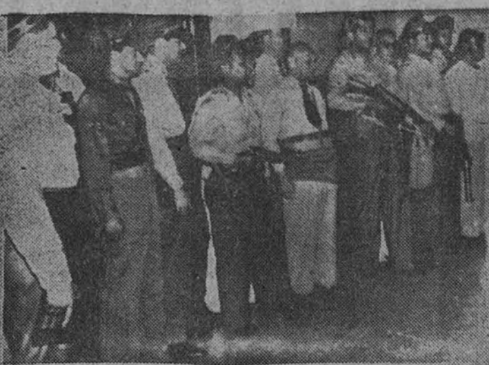
Al no aceptar la Asamblea Nacional panameña la revocación de la renuncia presentada por el Presidente Chan Kai Chek a dimitir por la Policía, éste, al frente de un grupo de sus partidarios—que aparecen en la foto de abajo felicitándole—, marchó a ocupar el Palacio presidencial. Chan Kai Chek y sus correligionarios no pudieron lograrlo, por lo que la Policía que hacía guardia en Palacio—foto superior—, la cual abrió fuego, hiriendo a varias personas y causando la muerte de un muchacho.