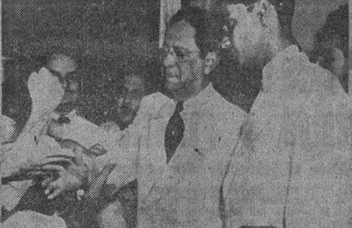
Al no aceptar la Asamblea Nacional panameña la revocación de la renuncia presentada por el Presidente Chan Kai Chek a dimitir por la Policía, éste, al frente de un grupo de sus partidarios—que aparecen en la foto de abajo felicitándole—, marchó a ocupar el Palacio presidencial. Chan Kai Chek y sus correligionarios no pudieron lograrlo, por lo que la Policía que hacía guardia en Palacio—foto superior—, la cual abrió fuego, hiriendo a varias personas y causando la muerte de un muchacho.