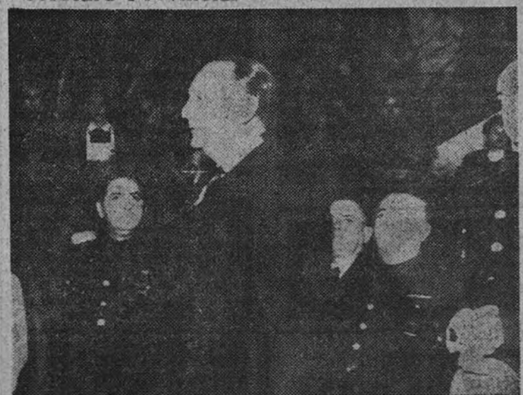
El Ministro de Justicia y Secretario General del Movimiento, camarada Raimundo Fernandez-Cuesta, durante el discurso que pronunció en la Jefatura Provincial del Movimiento de Córdoba.

Pronunció un importante discurso en la Jefatura Provincial del Movimiento