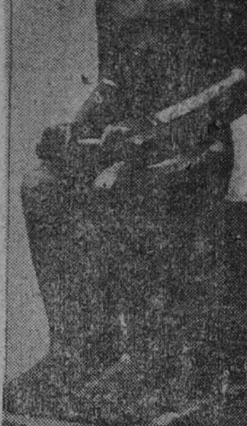
La última obra de Mateo Hernández: "El escultor, sentido".

Recordando cosas de Mateo no terminaría una nunca. Era una personalidad enorme y atípica. El ejemplo impresionante del verdadero artista genial que entendía el genio de la obra con un realismo atroz y una servidumbre a la verdad hecha culto. No creo que hayamos tenido nunca nada parecido. Tal vez, el realista económico sin regatos, no le faltaba más que morir, que es lo que ahora ha hecho. Muere Mateo del corazón, como si éste se