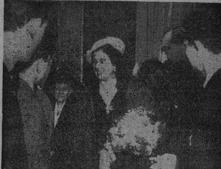
La esposa de Su Excelencia el Jefe del Estado, doña Carmen Polo de Franco, es acompañada por una Comisión de estudiantes de la Universidad de Oviedo en uno de los salones del Ayuntamiento de la ciudad.

Ayer inauguró en Mieres un Dispensario de la Cruz Roja y un Hogar de Auxilio Social