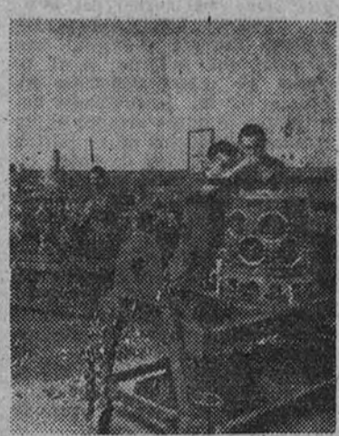
Un rincón del taller de montaje de motores

Esto significa, naturalmente, que no sólo el personal de vuelo de la