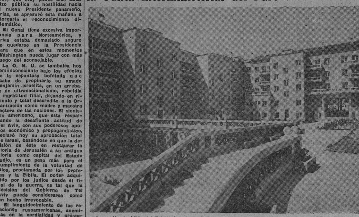
La acción decidida del Estado impulsa y facilita la construcción de numerosas y modernas viviendas

Han sido concedidos en calidad de préstamos por la Junta Interministerial del Paro