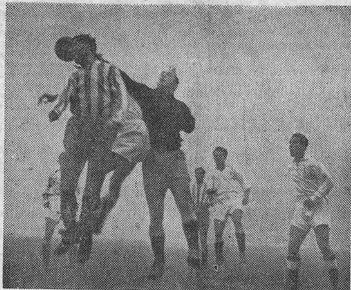
El portero del Deportivo tuvo intervenciones tan acertadas como la que muestra la foto, en la que despeja, en colaboración con su defensa, una peligrosa situación ante la expectativa de los delanteros madrildistas