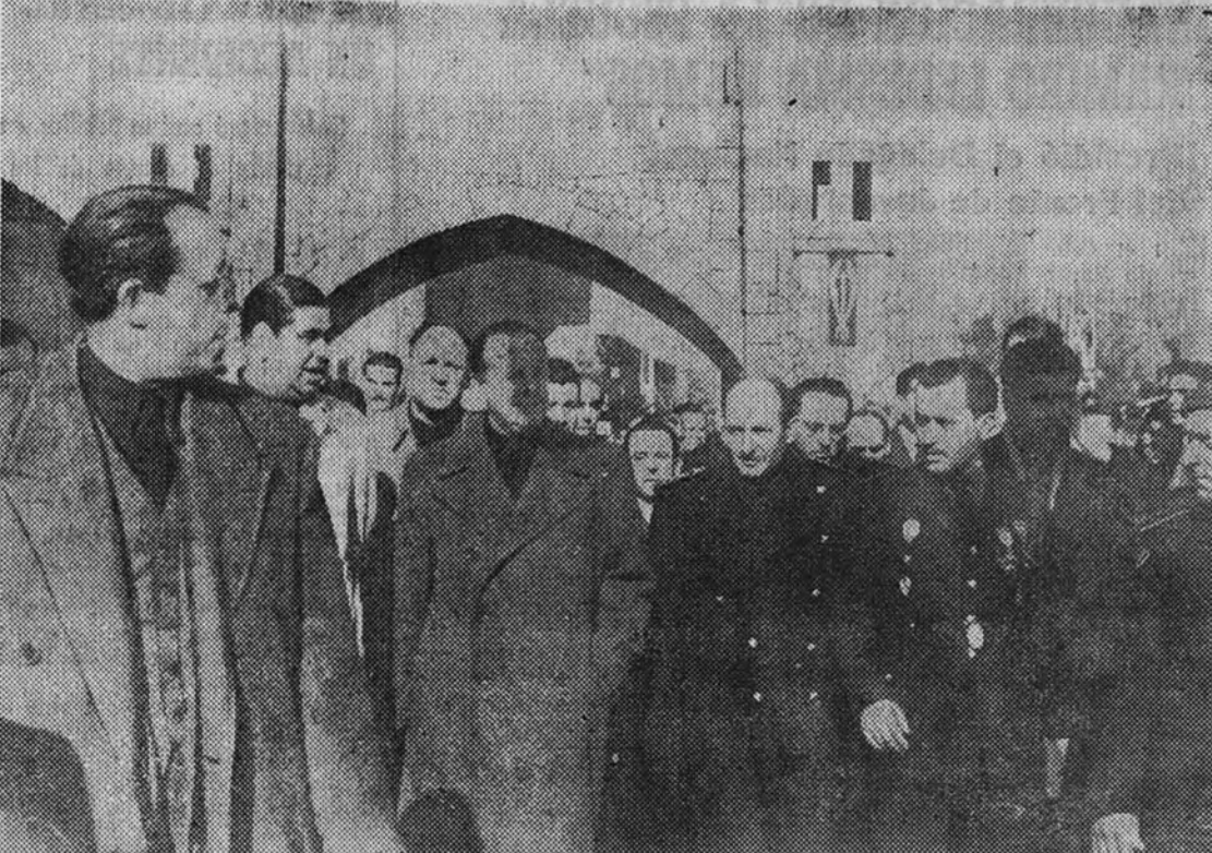
El Ministro y Secretario General del Movimiento, a su llegada a Puertollano, acompañado del Jefe Provincial del Movimiento, el Delegado Provincial de Sindicatos y otras jerarquías

La Granja-Escuela de Daimiel, inaugurada en el mismo día por el Secretario General del Movimiento, es obra también de la Falange. Los enormes beneficios que al agro español representa, al lado de otras creaciones similares, son también indiscutibles. La Obra Sindical de Colonización ha recogido los informes previos para la instalación, ha confeccionado proyectos y llevado la dirección de las obras, y ha conseguido su culminación felizísima. Lo mismo, exactamente igual, que en otros grupos de colonización de esta y otras provincias españolas. Estos Grupos Sindicales de Colonización han conseguido despertar la iniciativa privada en el campo y en su seno reúnen a numerosos cam-