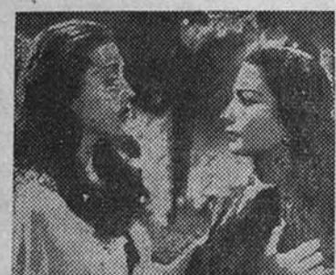
Centro Films ha producido "El amor brujo", inspirada en el poema infantil de Manuel de Falla. He aquí un fotograma de la cinta.

"LEGADA DE NOCHE" José Antonio Nieves Conde, el joven realizador de "Angustia", ha puesto a contribución toda experiencia y conocimiento del arte de mover los personajes con una maestría inusitada.