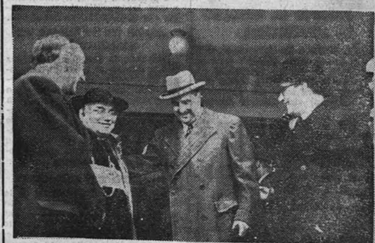
El señor Martín Artajo conversa con el Nuncio de Su Santidad, el Ministro de Educación Nacional y el embajador de España en la Argentina, momentos antes de subir al avión que los condujo a Roma