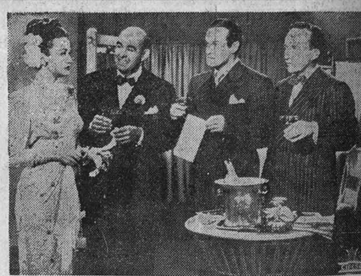
Los ases norteamericanos de la risa, Bing Crosby y Bob Hope, con la estrella Dorothy Lamour, en un episodio de "Camino de Río", comedia cinematográfica que, presentada por Cifesa, se estrena hoy en el cine Rialto.

Su sensacional estreno en el Rialto se anuncia para hoy jueves, por lo que será el "gordo" de la alegría.