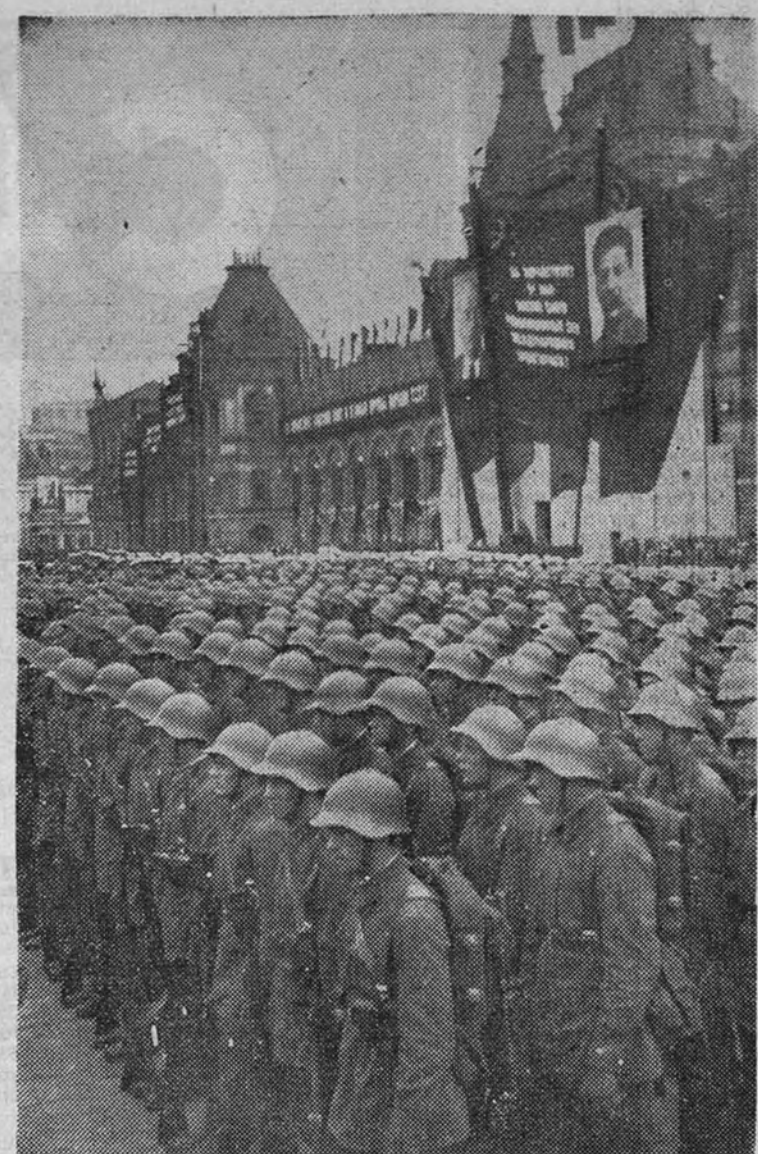
Una propaganda obsesante y la amenaza de las bayonetas del Ejército rojo, garantizan ampliamente las candidaturas únicas impuestas por el Kremlin en las "elecciones" soviéticas

después de la guerra mundial, por la continuada y activa campaña que se hizo para forzar el regreso de ciudadanos soviéticos, y muchos de los cuales se negaron a volver a la Unión Soviética. Y aun hubo algunos de éstos que se suicidaron al temer la fuerza. Pregunté sobre el caso a Vichinsky, quien me contestó sin turbarse que el partido comunista, en su territorio, ciudadanos contra la voluntad de éstos; pero que muchas de estas personas a las que dábamos asilo eran traidores o "criminales de guerra". Pero ahora lo comprendo todo mejor. El Gobierno soviético se da perfecta cuenta de los peligros que entraña la presencia en el extranjero de millones de personas que pueden dar testimonio, y así lo han indudablemente, como testigos dignos de todo crédito, sobre los métodos empleados por el Estado policiaco, o que, por medio de patentes o amigos que aun residen en la Unión Soviética, podrían recibir y publicar noticias de este género. Los comunistas conocen la actitud hostil de la mayoría de estas personas que han