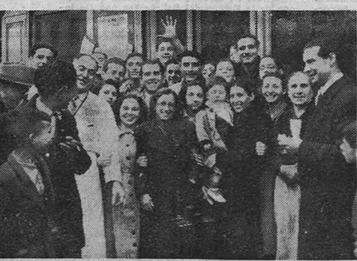
Uno de nuestros redactores rodeado de personas a las que ha correspondido el tercer premio, en pequeñas participaciones adquiridas en un bar de la calle de Valencia