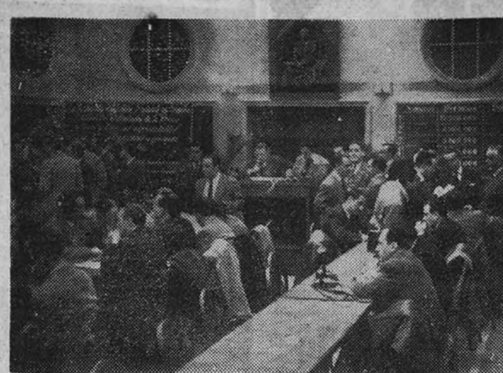
La nueva sala de la central telefónica de Hermsolía, desde la que los periodistas siguieron el sorteo