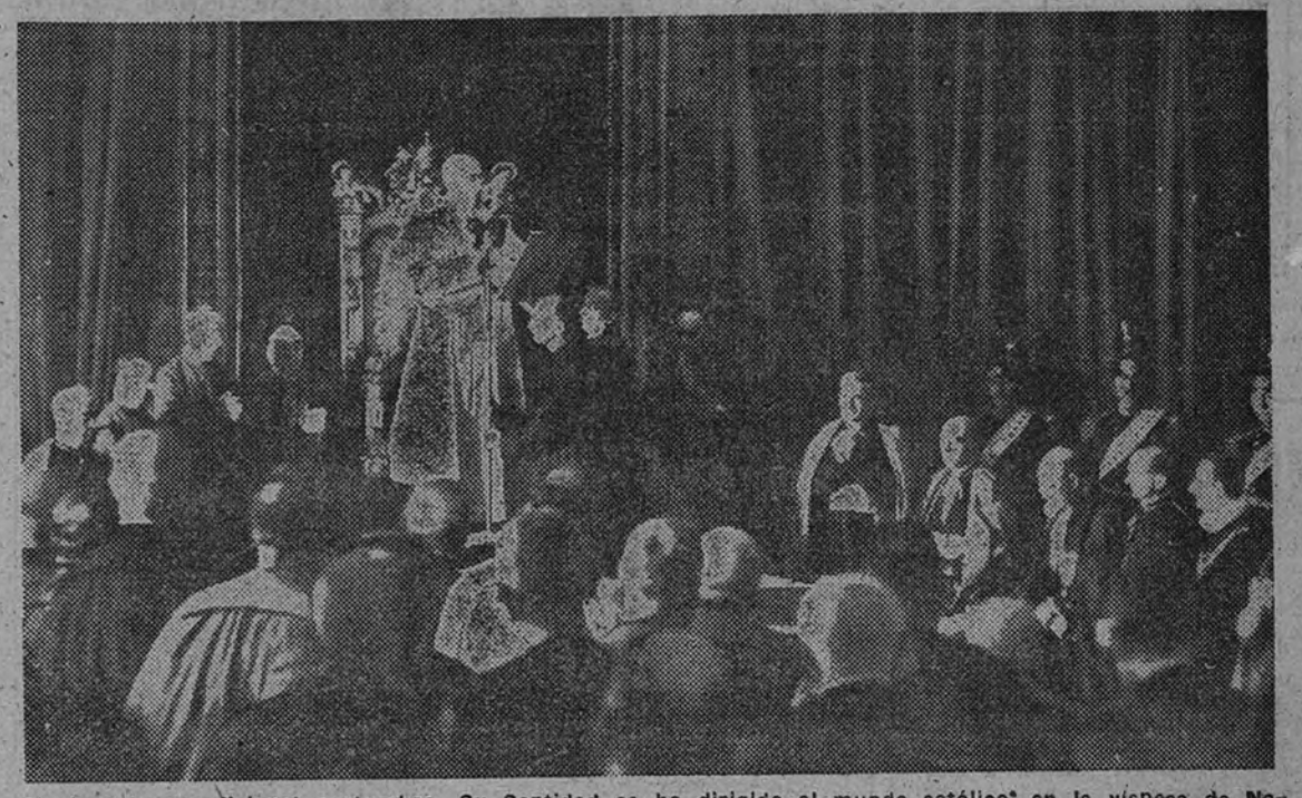
Seguendo la tradición costumbre, Su Santidad se ha dirigido al mundo católico, en la víspera de Nochebuena, con un mensaje de paz y de unión, en el que invitó a regresar al seno de la Iglesia de Roma a todos los católicos que la hayan abandonado. El Santo Colegio Cardenalicio, escuchando la alocución del Pontífice

Nada se opone a que Vd. celebre las fiestas familiares con la tradicional alegría de la mesa donde se suele comer y beber con menos moderación que de costumbre. Procure, no obstante, ya que no olvida el buen champaña, ni el pavo tierno, ni los turrones, ni el habano, acordarse también de que la «Sal de Frutas» ENO reparará los trastornos que el exceso pueda causar en su organismo. Entre tantas bebidas tóxicas y comidas indigestas, «Sal de Frutas» ENO actuará como un antídoto, restableciendo el equilibrio fisiológico.