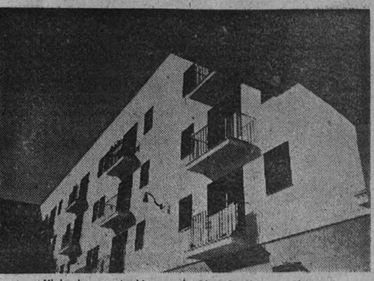
Viviendas construidas por la Obra Sindical del Hogar

A los Sindicatos Nacionales que se mencionan les fueron concedidos estos otros créditos: Sindicato Nacional de la Alimentación, 53.000 pesetas; Sindicato Nacional de Ganadería, 70.000 pesetas; Sindicato de Hostelería, 2.500 pesetas; Sindicato del Metal, 17.657,50 pesetas; Sindicato del Papel y Artes Gráficas, 7.000 pesetas; Sindicato de la Pesca, 72.760,70 pesetas; Sindicato del Seguro, 3.402,65 pesetas. Para la Obra Sindical de Artesanía, subvención de 10.000 pesetas, destinadas a Formación Profesional, y 57.000 pesetas, para edición de folletos de los mercados de artesanía. Obra Sindical de "Formación Profesional", pesetas 370.000 para adquisición de maquinaria y útiles con destino a