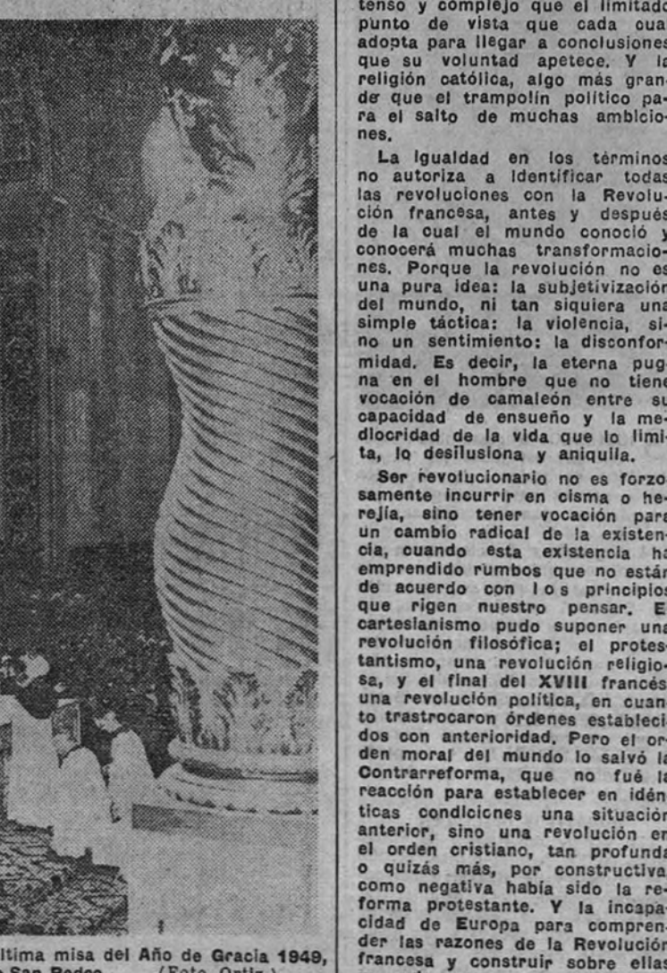
Su Santidad el Papa celebrando la última misa del Año de Gracia 1949, en la Basílica de San Pedro.

CIUDAD DEL VATICANO.—La resistencia física de Su Santidad el Papa Pío XII se ha resentido, por efecto de sus muchas ocupaciones, durante la semana inaugural del Año Santo, si bien no es de temer ningún estado de consideración, dice la agencia United Press. Añade que el doctor Galeazzi-Lisi, médico de cátedra del Papa, ha manifestado: "Como es natural, el Pontífice se ha