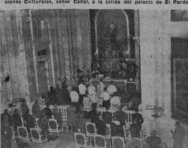
El Caudillo, acompañado de su esposa e hija, asiste a la misa de rito maronita celebrada en la capilla de palacio