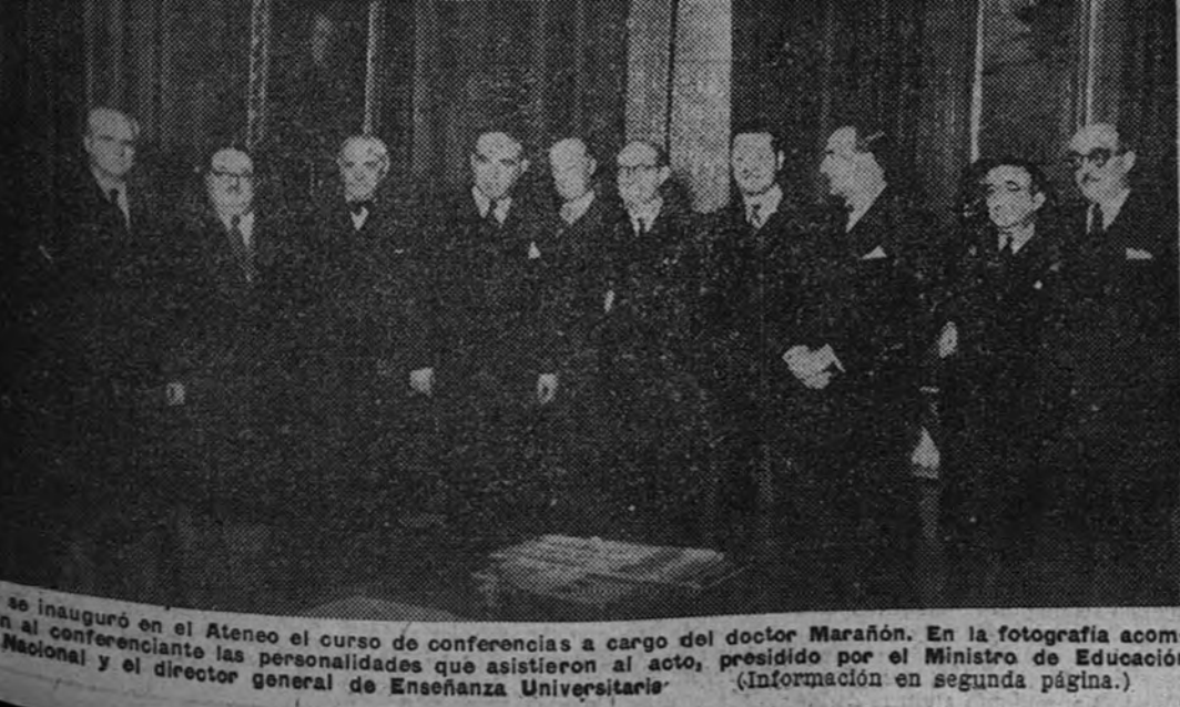
Se inauguró en el Ateneo el curso de conferencias a cargo del doctor Marañón. En la fotografía acompañan al conferenciante las personalidades que asistieron al acto, presidido por el Ministro de Educación Nacional y el director general de Enseñanza Universitaria.