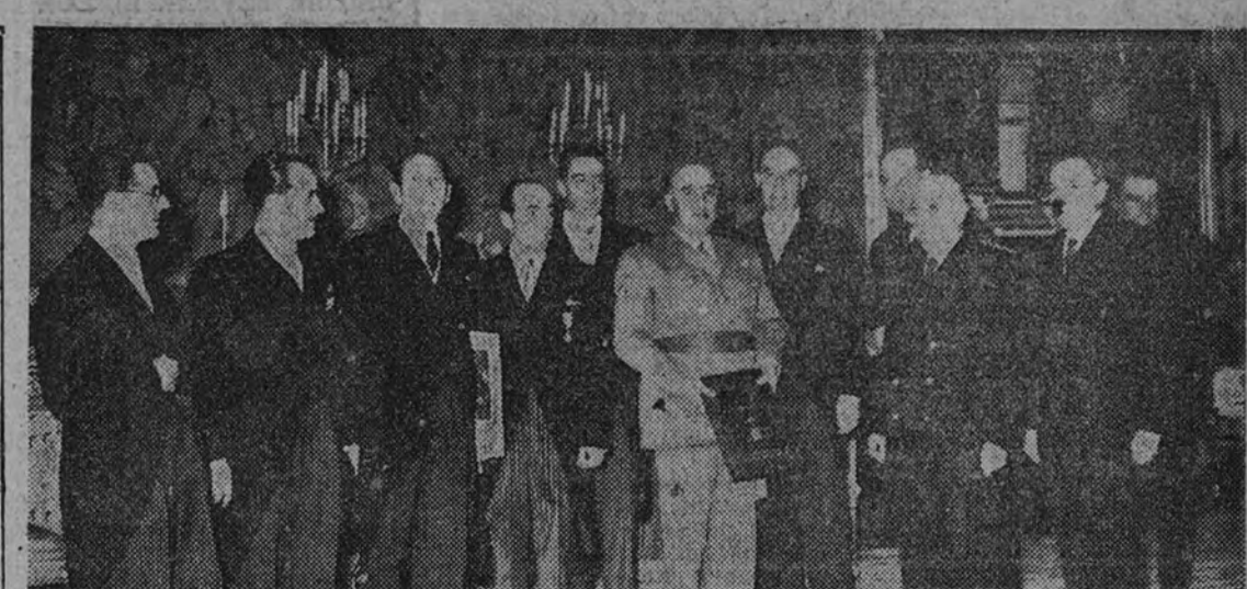
Su Excelencia el Jefe del Estado, con los miembros de la Federación Española de Pesca, que acudieron a cumplimentarle. En la foto posterior, el ilustre señor obispo de Cutack (India), acompañado de su secretario y del visitador de los padres paules, durante la audiencia concedida por el Generalísimo a Su Ilustrísima en el día de ayer.

La Formación Profesional fue atendida con 2.377.118,33 pesetas, quedando pendiente de invertir en este año 7.481.263,32 pesetas, la mayor parte de cuyo montante ha