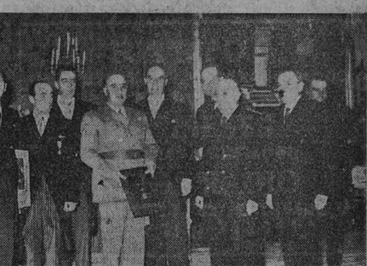
Su Excelencia el Jefe del Estado, con los miembros de la Federación Española de Pesca, que acudieron a cumplimentarle. En la foto posterior, el ilustre señor obispo de Cutack (India), acompañado de su secretario y del visitador de los padres paules, durante la audiencia concedida por el Generalísimo a Su Ilustrísima en el día de ayer.