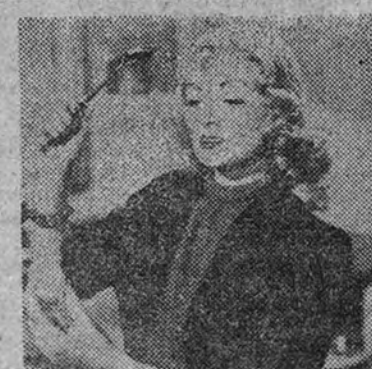
Constance Bennett, primera figura femenina de la farisa comedia norteamericana, "Un mendigo original", próxima a estrenarse

Los sutiles contrastes de ambas generaciones, diferenciadas por unas costumbres, una moral y un concepto peculiar de la vida, maravillosamente enlazadas por un realizador tan notable como Irving Reis, hacen de "Hechizo" uno de los temas que conmueven y apasionan a todos los públicos. Son protagonistas de esta cinta David Niven y Teresa Wright.