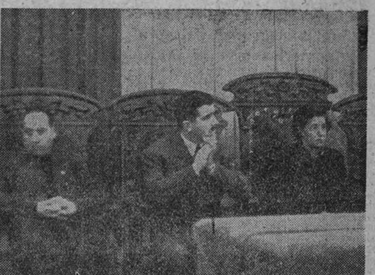
La Delegada Nacional de la Sección Femenina, Pilar Primo de Rivera, acompañada del Gobernador y Jefe Provincial de Tarragona y otras autoridades, en una de las sesiones del Congreso.

En España, aludió a las actividades en el ámbito internacional, y en particular al Congreso Internacional de Copenhague, en el que se presentaron fotografías y publicaciones sobre el estado actual de la educación física en España. Cita palabras del Pleno del Consejo Nacional de Deportes, referentes a la Olimpiada de 1952, y dice que, de haber presentado España un numeroso grupo en la segunda "Lingüística", hubiera quedado muy alto el pabellón español. Se refirió a la intervención de una muchacha de Zaragoza, campeona de la Sección Femenina de España, y que actualmente, en la II Semana Internacional de Copenhague, ha conquistado un segundo puesto, delante de una esquiadora alemana y otra francesa.