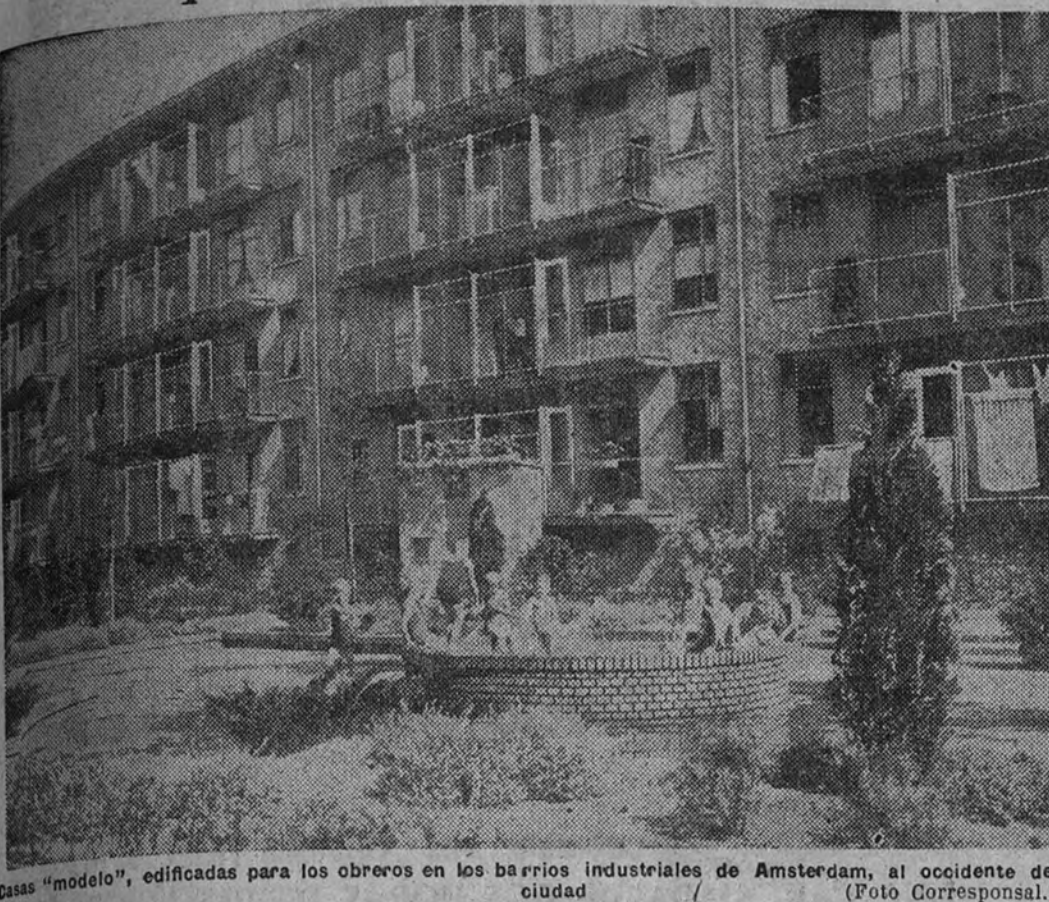
Casas "modelo", edificadas para los obreros en los barrios industriales de Amsterdam, al occidente de la ciudad.