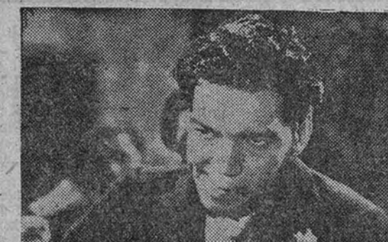
Se anuncia para mañana lunes en la pantalla del Capitol la reaparición del gracioso actor en el año 1949. Mario Moreno "Cantinflas". La nueva comedia se titula "A volar, joven", y será presentada por Columbia Films

TERCERA SEMANA DE "LA ATLANTIDA. MILAGROS DEL AMOR EN UNA CREACION DE CANTINFLAS