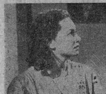
La estrella Olivia de Havilland en la impresionante película de la Fox "Nido de víboras", que desde mañana se exhibirá en los cines Luchana y Progreso