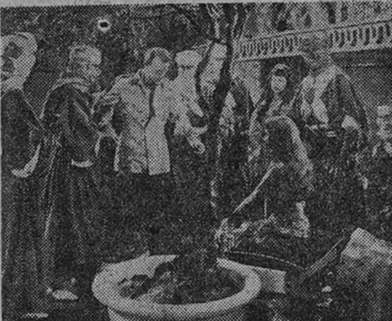
Entra en su tercera semana de éxito en el Avenida, la nueva producción cinematográfica de "La Atlántida", interpretada por María Montez y Jean Pierre Aumont. La película ha sido producida por Artistas Unidos y dirigida por Arthur Ripley

"¡Pobre mi madre querida!" entra en las dos semanas de su exhibición en el cine Imperial.