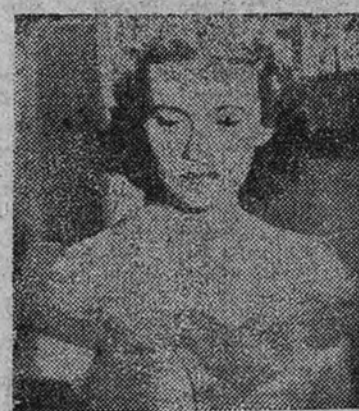
Quando el amor muere, le sustituye la nostalgia. "Hechizo", presentada por C. B. Films, es la más maravillosa historia de amor cinematográfica

"Un marido ideal", auténtico acontecimiento de la temporada, es otro gran triunfo indiscutible del cine mundial, que Selecciones Capitolio presenta mañana lunes en el Palacio de la Música, su marco