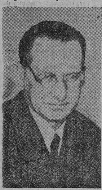
Alcide de Gasperi

DIARIO DE LA MAÑANA — ORGANO DE FALANGE ESPAÑOLA TRADICIONALISTA Y DE LAS J. O. N. S. — LARRA, 14, TELEFONO 23 26 10 — 50 CTS.