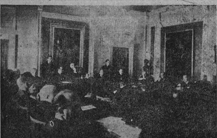
Los Ministros de Asuntos Exteriores y Justicia presidiendo la sesión necrológica del Consejo de Estado, en memoria del que fue su Presidente

Presidieron los Ministros de Asuntos Exteriores, Gobernación, Ejército, Justicia y Obras Públicas