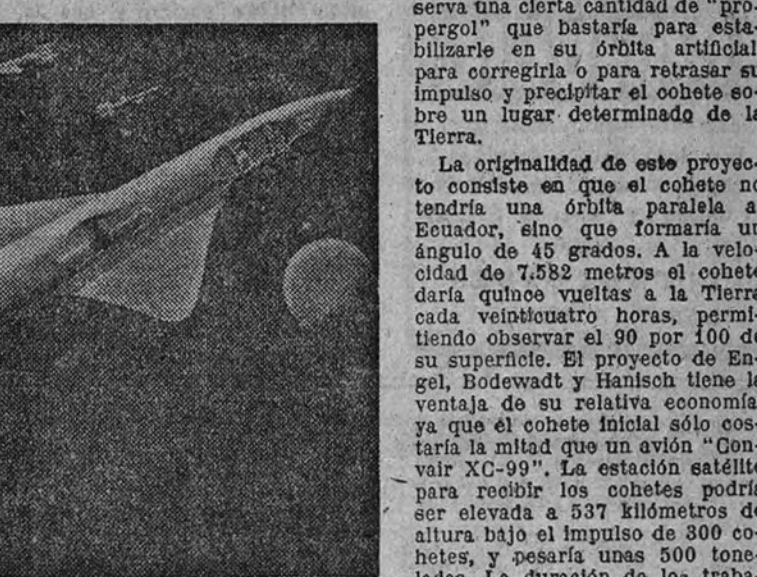
Los primeros cohetes interplanetarios serían gigantes bombas "V", sin carga explosiva, capaces de alcanzar la superficie de la luna