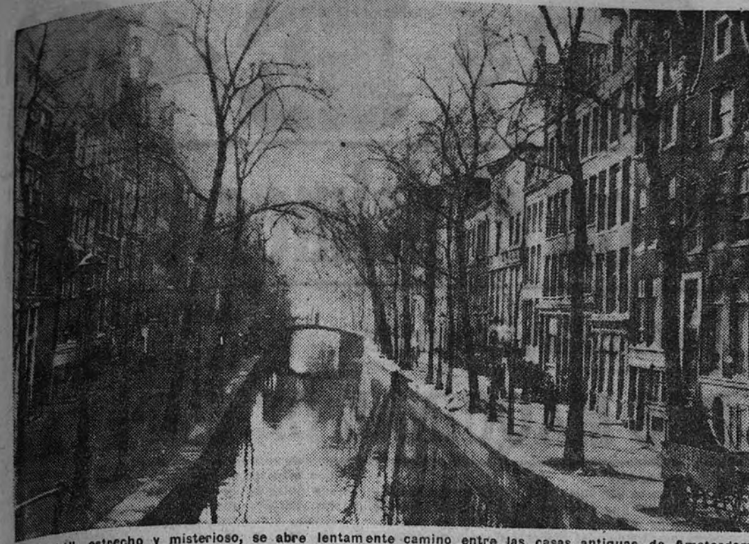
Un "gracht", estrecho y misterioso, se abre lentamente camino entre las casas antiguas de Amsterdam