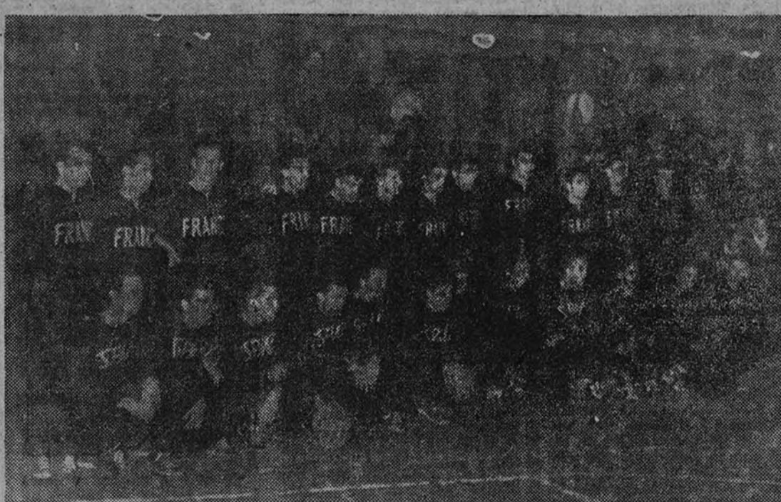
Las selecciones francesa y española momentos antes de dar comienzo el encuentro que anoche jugaron en el frontón del Real Madrid, y que terminó con la victoria española por 46 puntos a 31

La velocidad de nuestros seleccionados desconcertó a los franceses