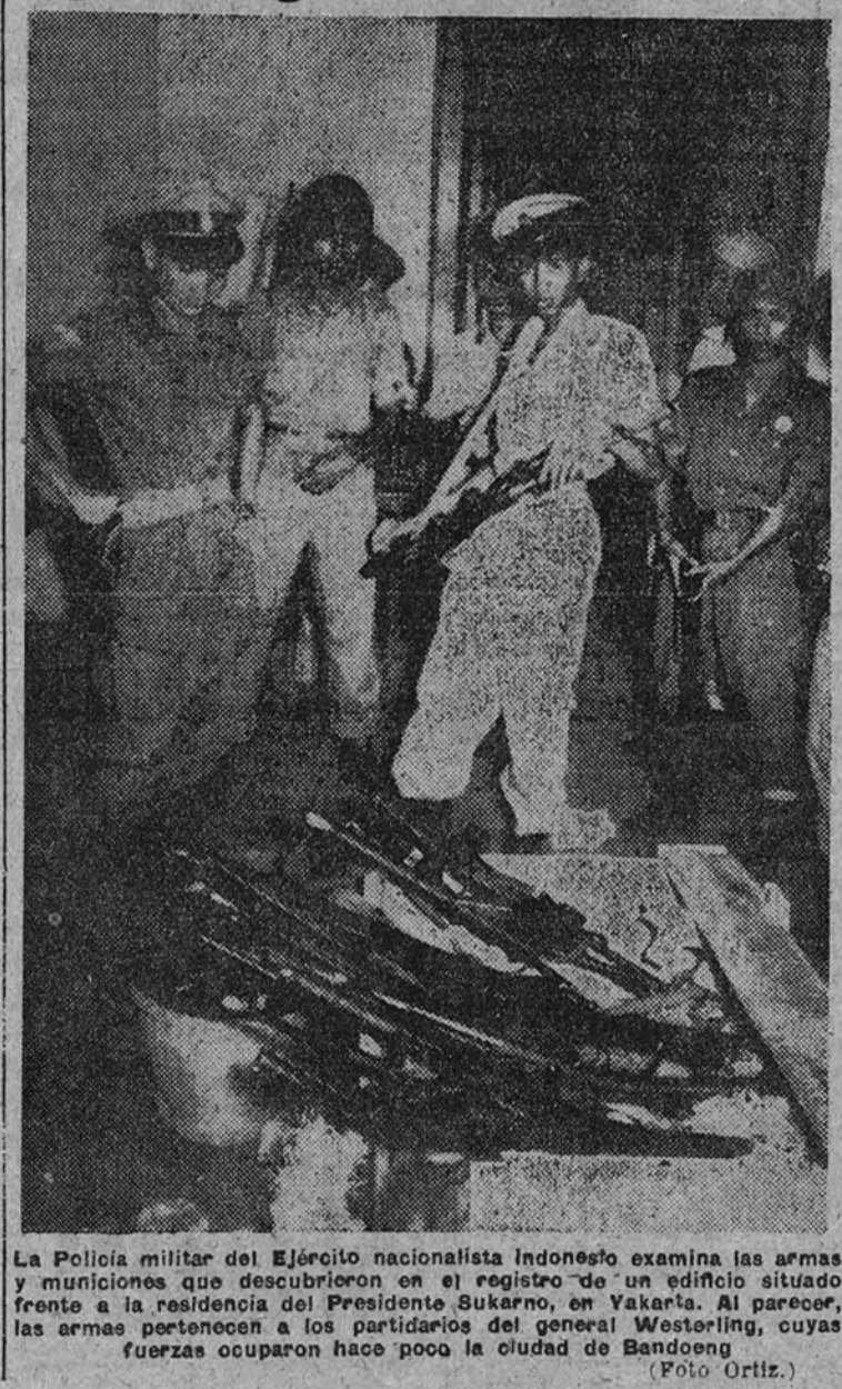
La Policía militar del Ejército nacionalista indonesio examina las armas y municiones que descubrieron en el registro de un edificio situado frente a la residencia del Presidente Sukarno, en Yakarta. Al parecer, las armas pertenecían a los partidarios del general Westerling, cuyas fuerzas ocuparon hace poco la ciudad de Bandung.