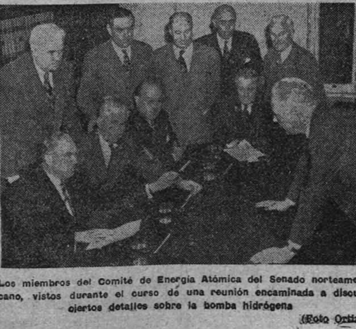
Los miembros del Comité de Energía Atómica del Senado norteamericano, vistos durante el curso de una reunión encaminada a discutir ciertos detalles sobre la bomba hidrúgena.