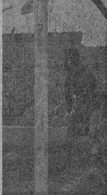
Hernández Coronado cree que el Madrid tuvo mala suerte y que el triunfo pudo quedar asegurado en la primera parte

—Se ha jugado con arreglo a las circunstancias. Impuestas por el estado del terreno.