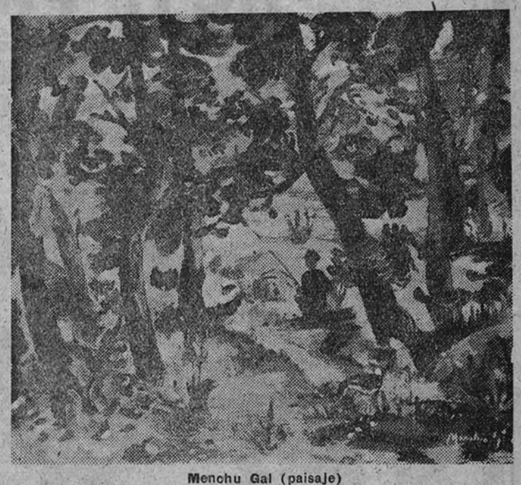
Menchu Gal (paisaje)