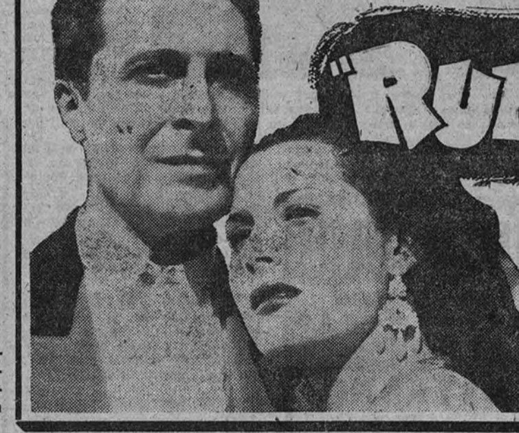
EN COLOR POR CINEFOTOCOLOR Fernando de Granado Paquita Rico Fernando Fdez. de Córdoba DIRECTOR: RAMON TORRADO