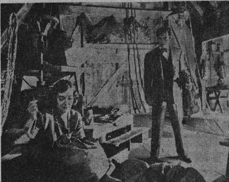
El volvió al molino llevando en la mano el violín que tanto había impresionado a Belinda unas horas antes. Pretendía engañarla, burlar su ignorancia de las cosas de este mundo... "Belinda", esa maravillosa película, orgullo de la Warner Bros, se estrena hoy en Colisevm con caracteres de gran acontecimiento cinematográfico.