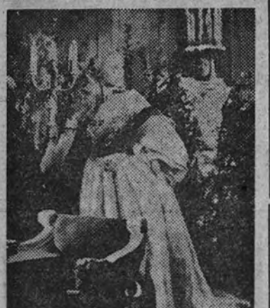
"La bella y la bestia", de Jean Cocteau, será presentada por Ullargui Films. He aquí un fotograma de tan interesante producción.

Presentada por Ullargui Films a nuestro público en fecha próxima, será, sin duda, la superproducción europea de más calidad artística que se ha proyectado sobre las pantallas. Su éxito es el éxito del séptimo arte como juego maravilloso de la fantasía en una visión plástica rebosante de vida e intención.