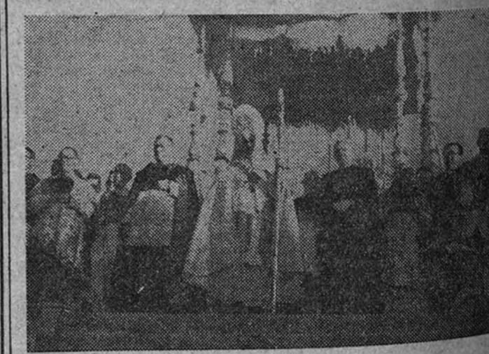
El acto inaugural de la Gran Misión en Málaga, que acaba de comenzar, ha revestido una extraordinaria solemnidad. En la foto, el obispo de Málaga, revestido de pontifical y acompañado del obispo milanes de Gorla, presidiendo dicho acto, al que asistió una gran muchedumbre.