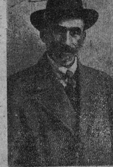
Don Jacinto Benavente en la época del estreno de "La Malquerida"

Y A existía una versión de "La Malquerida" en cine. No la vi. Yo suelo ir pocas veces al cine, y tan sólo voy cuando me recomiendan personas de cierta solvencia artística que asista a alguna proyección. Soy, además, de los que creen que el cine, al pretender ganar con palabras más terreno en el campo del arte, perdió en el juego. Porque el verdadero cine debe ser lo más aproximado posible a la poesía del silencio. En este sentido, la fotografía, tomada con original sentido del hombre y de la naturaleza, debe tener la profunda expresión de lo que sin pronunciar palabras nos sugiere un mundo misterioso de poesía y de verdad. Las emociones del cine debimos percibirlas con el menor número de palabras y con las situaciones dramáticas más sugestivas. Me decía una vez, hablando de cine, don Jacinto Benavente que a él el cine hablado le producía miedo. Y como le preguntase el porqué, me contestó con su sonrisa tan llena siempre de profunda ironía: "Me produce miedo una fotografía que hablan. Las fotografías, los retratos, deben permanecer ante nosotros en silencio. Eso de entrar en una casa o en una sala de espectáculos y escuchar de pronto la fotografía que debió servir para superarnos algún recuerdo, alguna diversión o algunas emo-